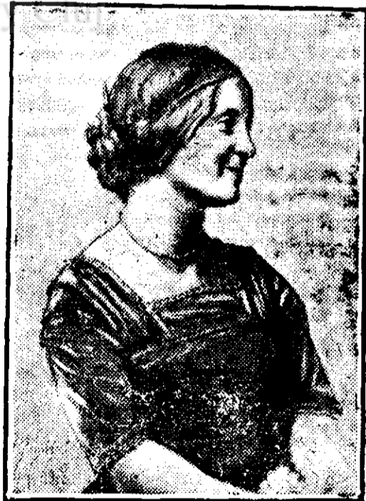
V. Gemito; Desen în creion

Da, numai el singur a putut să deștepte trăsăturile frumuseții antică care par'că au fost îngropate de vece în muzee și pinacoteci. Când privești la lucrările lui, te miri că autorul lor este un contemporan. El a moștenit toate liniile maestre și liniștite ale anticilor. Dar privești câte furtuni, cât suflet a tot văzător în operele lui, — și în aceasta e tot talentul lui de a fi pus o punte între două lumi.