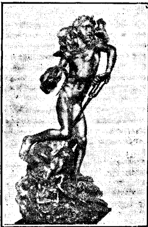
N. Gemito: Zeul vântului

Pentru sculptura lui Psihea a obținut în 1913 premiul Academiei de artă din Paris și a fost ales printre nemuritorii acestei Instituții.