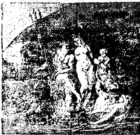
Fig. 8. Neptun și Amphitrită. (După Rubens cel mai celebru pictor din școala flamandă 1577-1631)

Acest lucru simbolizează, că în natură totul o sub stăpânirea marelui zeu din Cer, care e singurul suveran și independent din întreaga lume.