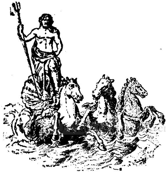
Fig. 9. Neptun călătorind pe mare.

Noți. — După o legendă, Neptun ar mai fi avut încă o soție