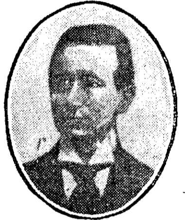
MARCONI marele inventator, care a inventat un nou aparat spre a împiedeca ciocnirea vaselor