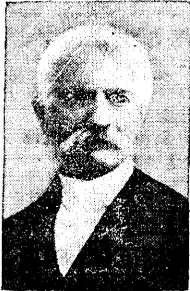
SONNINO ministru de externe al Italiei

— Rămân, face hotărât românul; daeă e să mor, mai bine să mor în oastea românească!