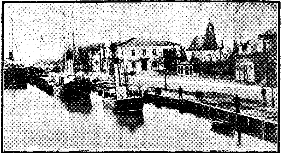
SULINA, în fața căreia săptămâna trecută s'a dat o luptă navală ruso-turcă