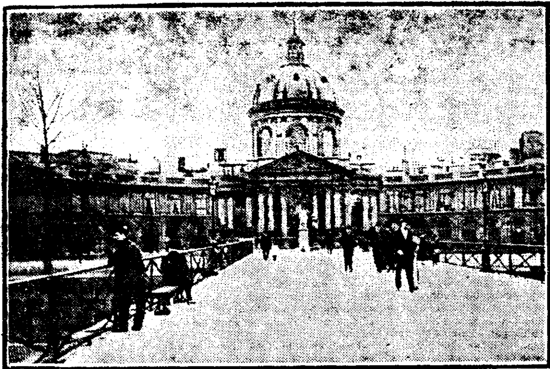
VEDERI DIN PARIS. — INSTITUTUL FRANȚEI