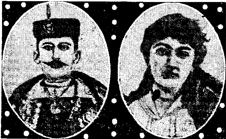
Prințul Mirko al Muntenegrului și soția sa principesa Natalia

Induișat de grijile care frământau pe bătrâna femeie, își propune că va face tot ce-i va sta în putință să le vie în ajutor. Dar cum!.. O iubea