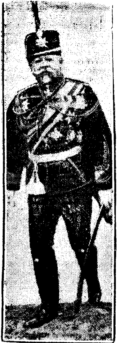
SUCHOMLINOFF fost ministru de război al Rusiei, dat judecâței

Cațavencu, Farfuridi, Celățeanu, Trahanache, Coana Ivițica, Pristanța și toți coifalți sunt oameni care