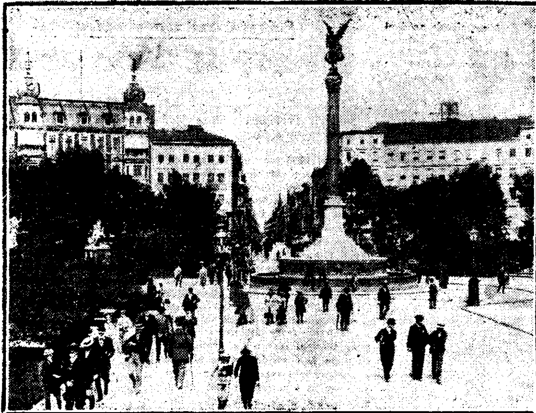
Vedere din Berlin

Matei. — Nu așa de iute, dragul meu. Li zici să intre: ușa face loc unui hoț în același timp grosolan și subtil, cam prost îmbrăcat, surăzător și totuși parc'ar voi să plângă, răspundând în juru-ți cât poate mai mult din parfumul locului natal și