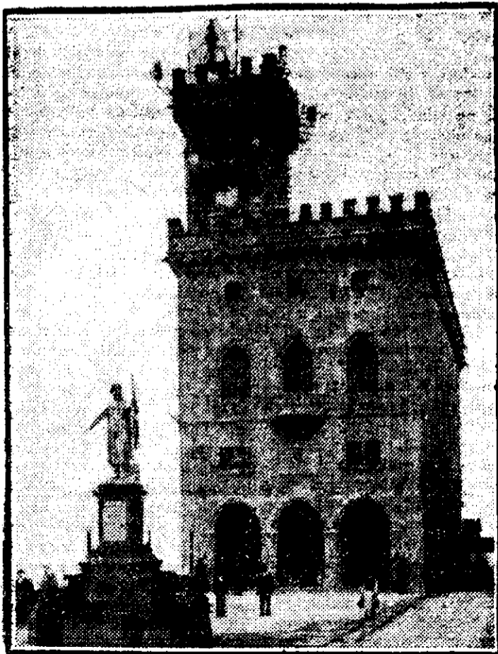
VEDERE DIN SAN MARINO