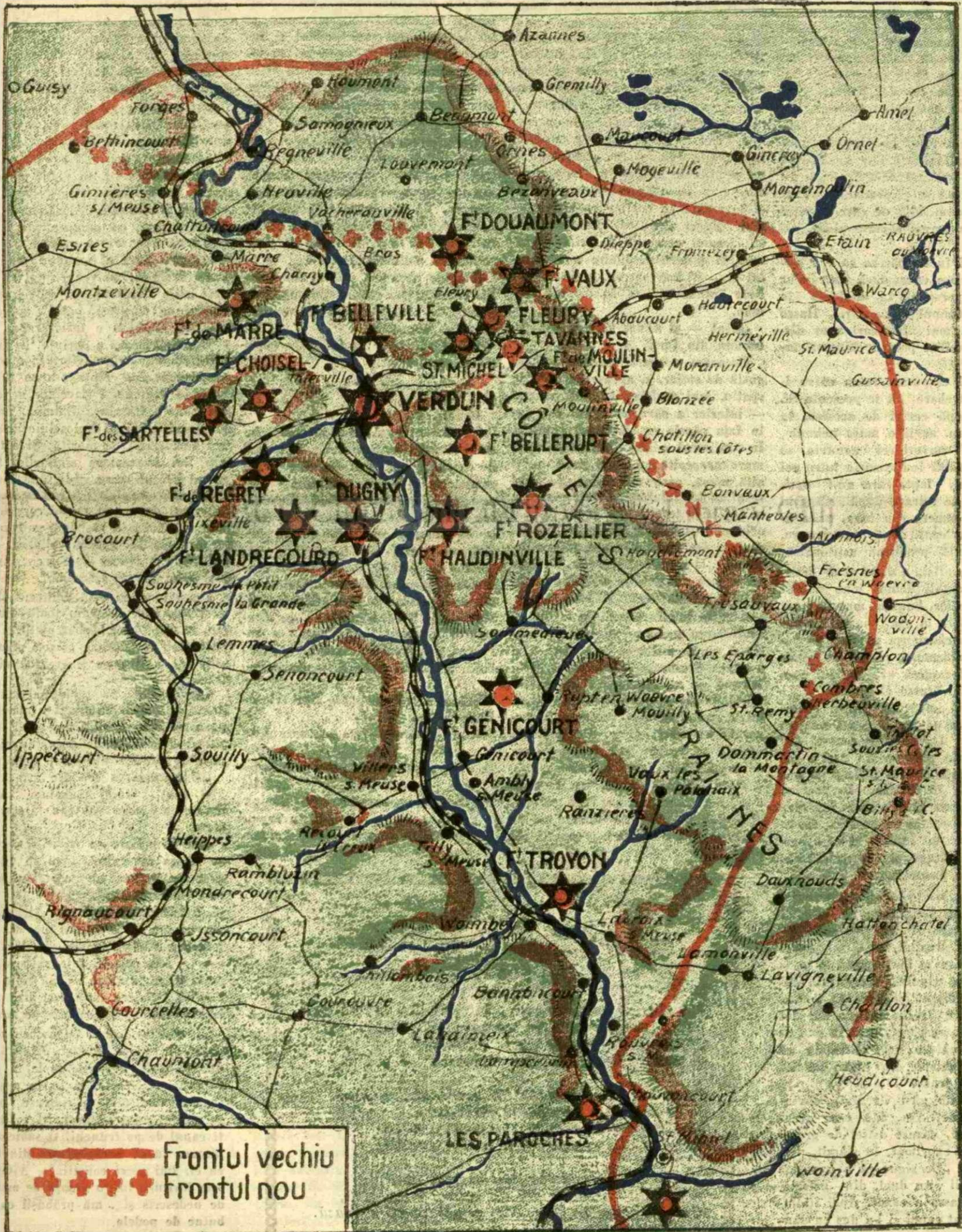
Harta regiunii Verdun și forturilor