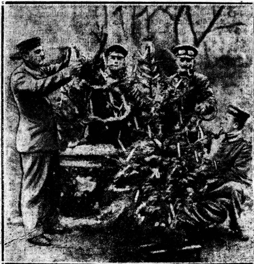
Grăciunii în tranșee.