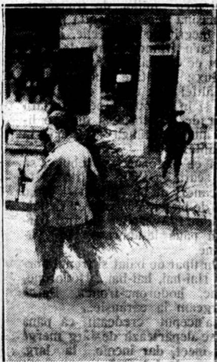
Bradel Crăciunului dus acasă