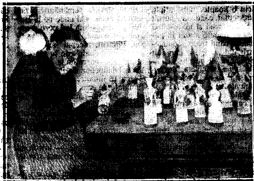
O bătrână care, de treizeci de ani, face țigari de carton

— Artileria lor urlă. Un locotenent vine spre mine fumîndu-și liniștit țigara și zîmbînd, în trosnetul proiectilelor. Un glon îl lovește în tâmplă: se sprijina de parapet cu amîndouă mîinile la spate; sîngele țîșnește cu violență; capul se înclină tot mai mult, apoi și corpul și a căzut.