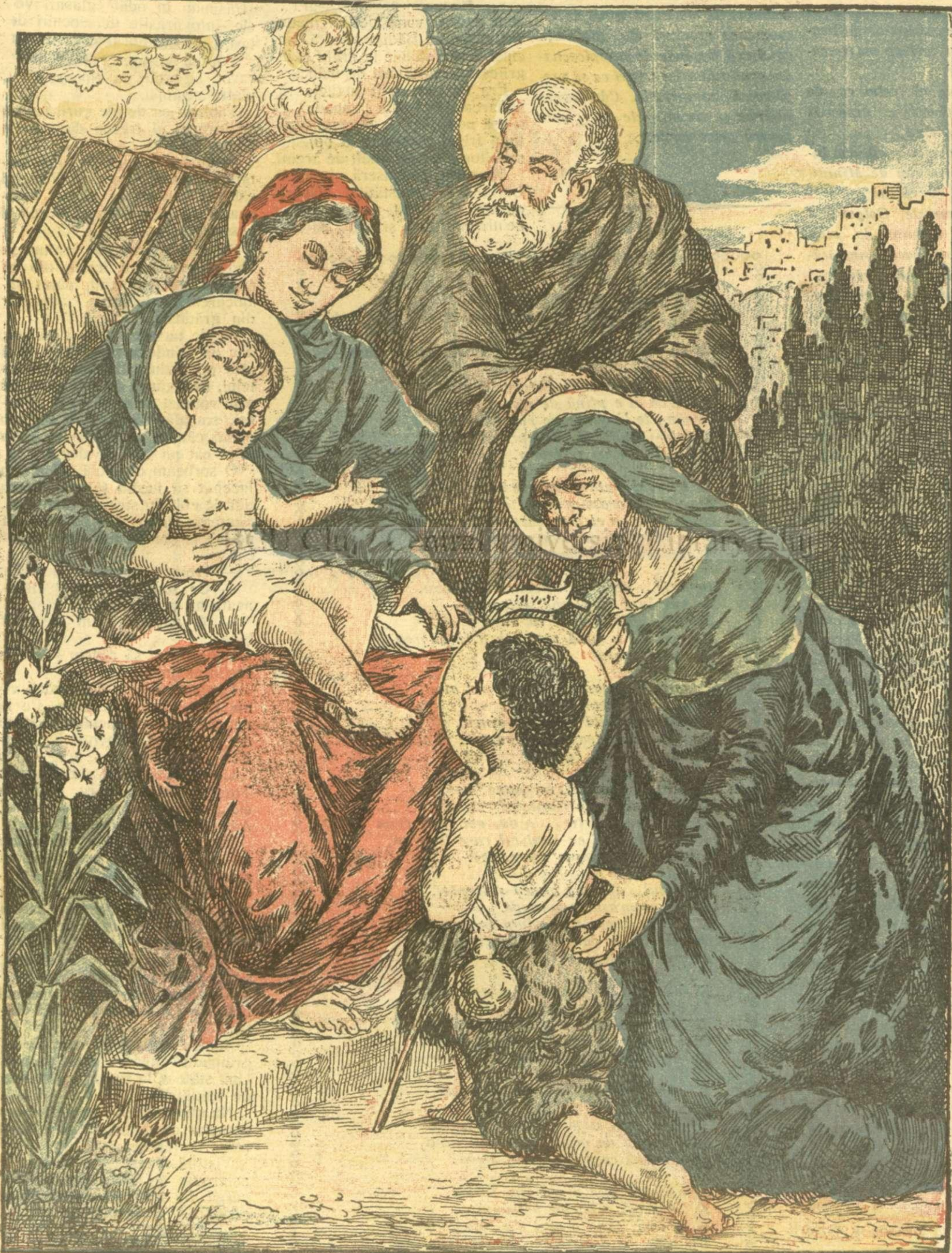
NAȘTEREA DOMNULUI NOSTRU ISUS CHRISTOS