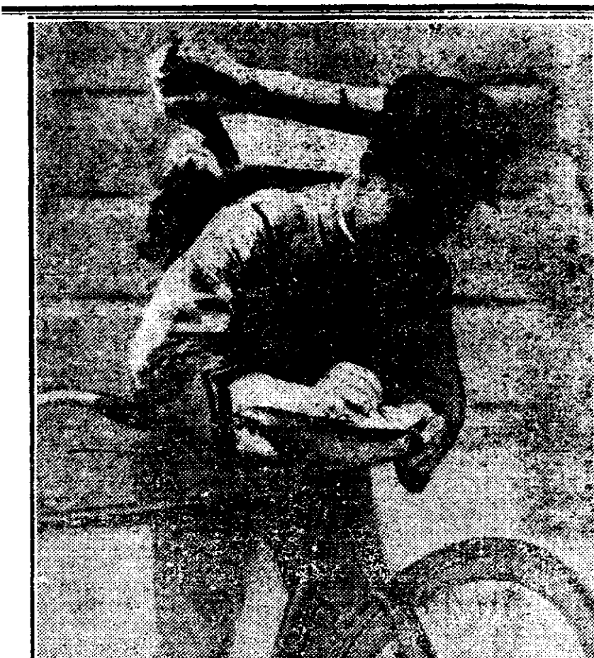
Ciclistul de infanterie italian scriind câteva rânduri părintilor săi

Pentru ori-ce reclamațiune sau schimbări de adrese, d-nii abonații sunt rugați a stața și una din benzile cu care primese ziarul „Universul Literar”, contrar, reclamațiunea sau schimbarea de adresă nu vor fi rezolvate.