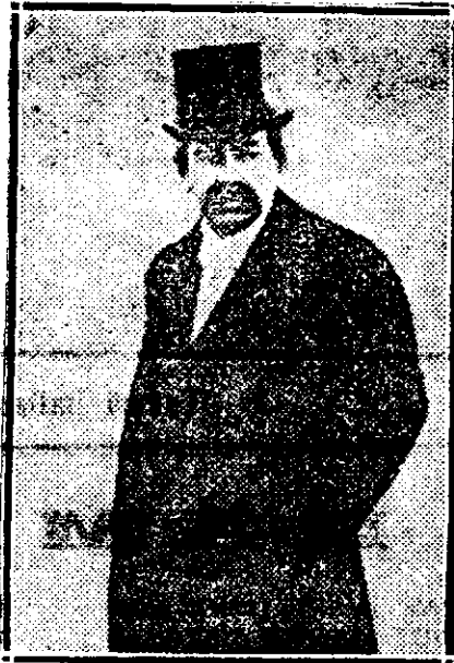
D-l Briand, primul-ministru francez