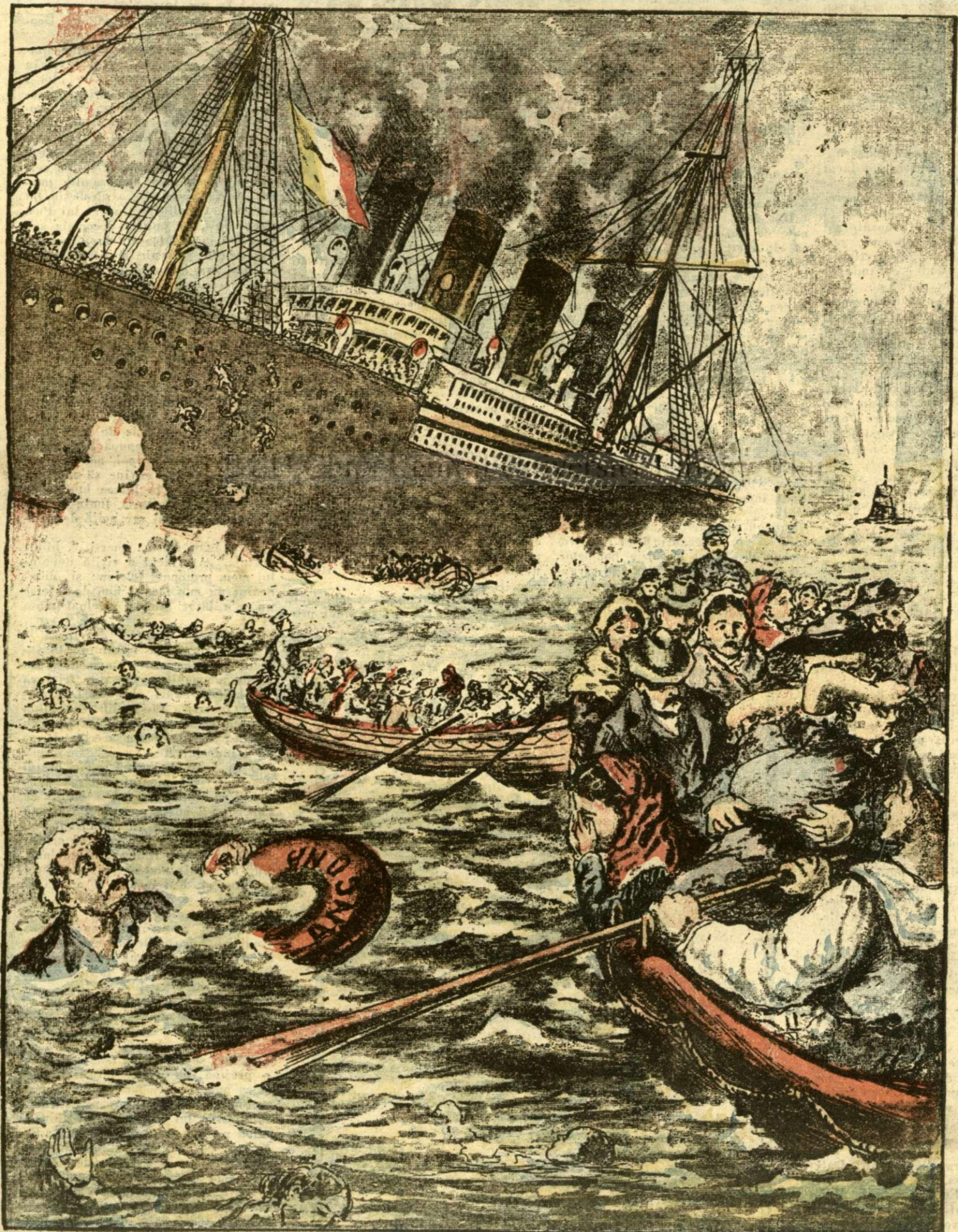
TORPILAREA VAPORULUI ITALIAN „ANGONA“