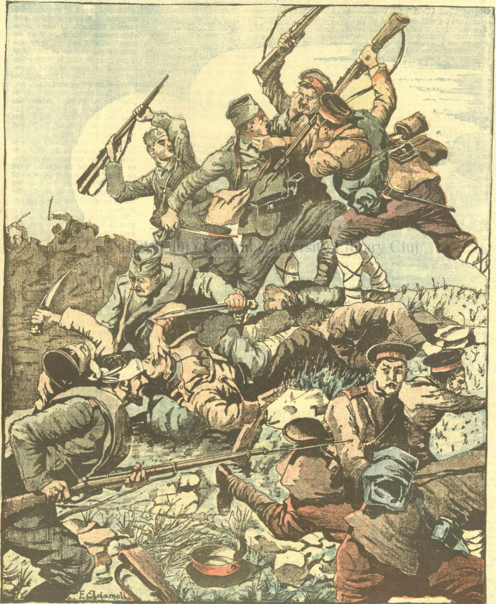
O luptă corp la corp între sârbi și bulgari

ANUNCIURI Linia pe pag. 7 și 8 — BANI 20 —