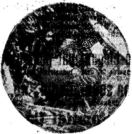
Correspondența în tranșee

Reisen e un scriitor evreu; nuvelele lui pîlindesc, sugestivă eugelerare talmudică: o îmbinare de ironie vioaie cu o înălțare îndușătoare.