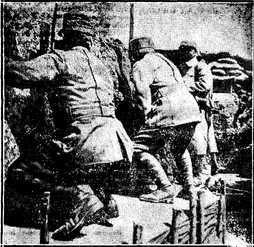
Intrebuințarea periscopului în tranșee.