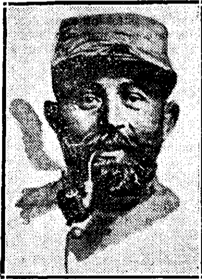
Tia de soldat francez

Pentru oricare reclamațiune sau schimbări de adrese — niți abonați sunt rugați a atașa și una din benzile cu care primese ziarul „Universul Literar”, contrar, reclamațiunea sau schimbarea de adresă nu vor fi rezolvate.