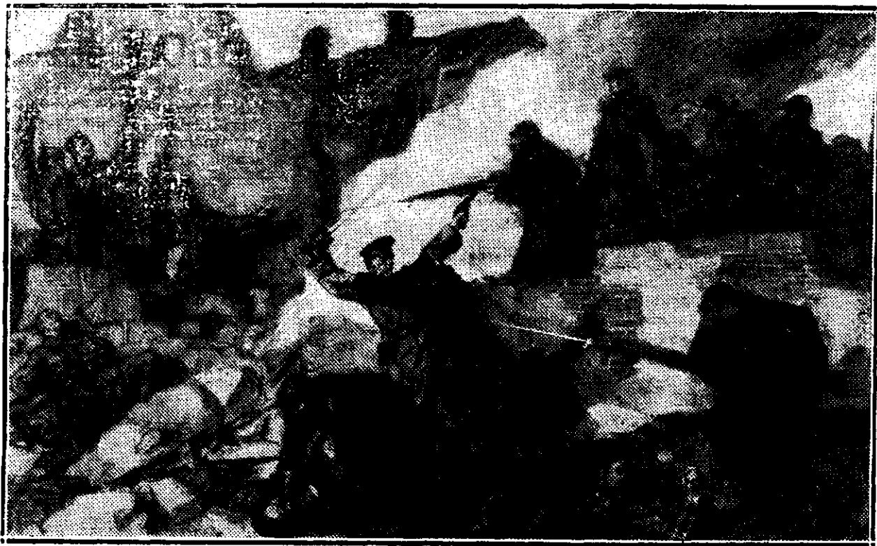
O luptă corp la corp pe străzile din Saint-Nazaire.