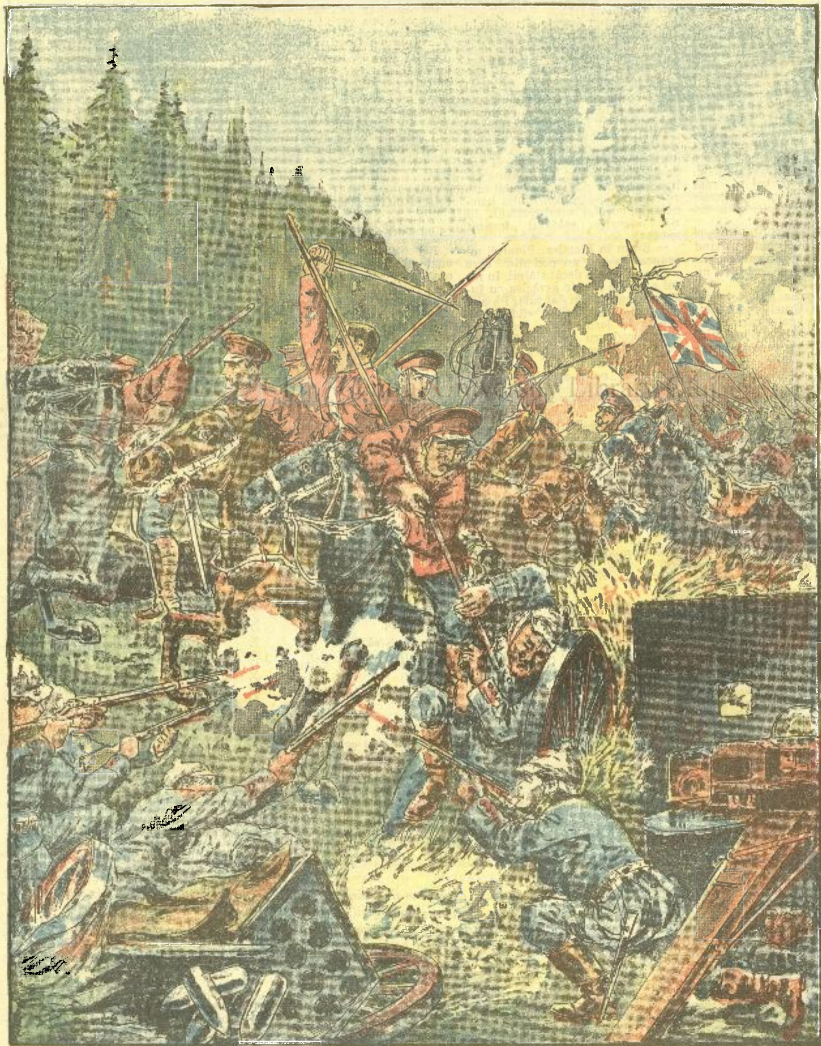
Cavaleria engleză atacă pe germani lângă La Bassée (Franta)

ANUNCIURI Linia pe pag. 7 și 8 — BANI 20 —