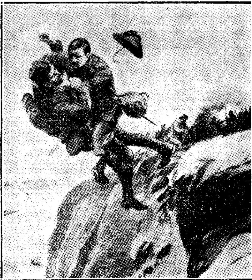
Luptă între un soldat australian și un turc