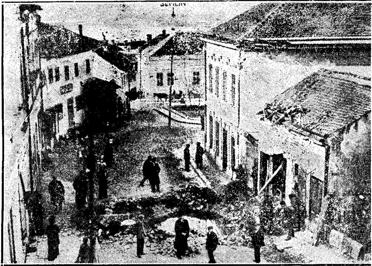
O stradă din Belgrad lovită de bombe austriace asvârlite din Semlin