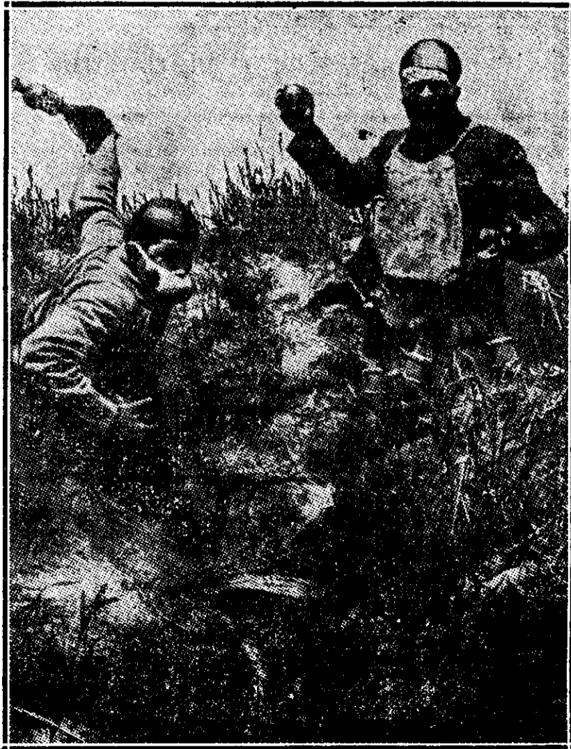
Doi soldați ascunși în găuri și purtând măști în contra gazelor asfixiante, asvârie bombe în tranșeele germane, săpate la 100 de metri de lângă ei.