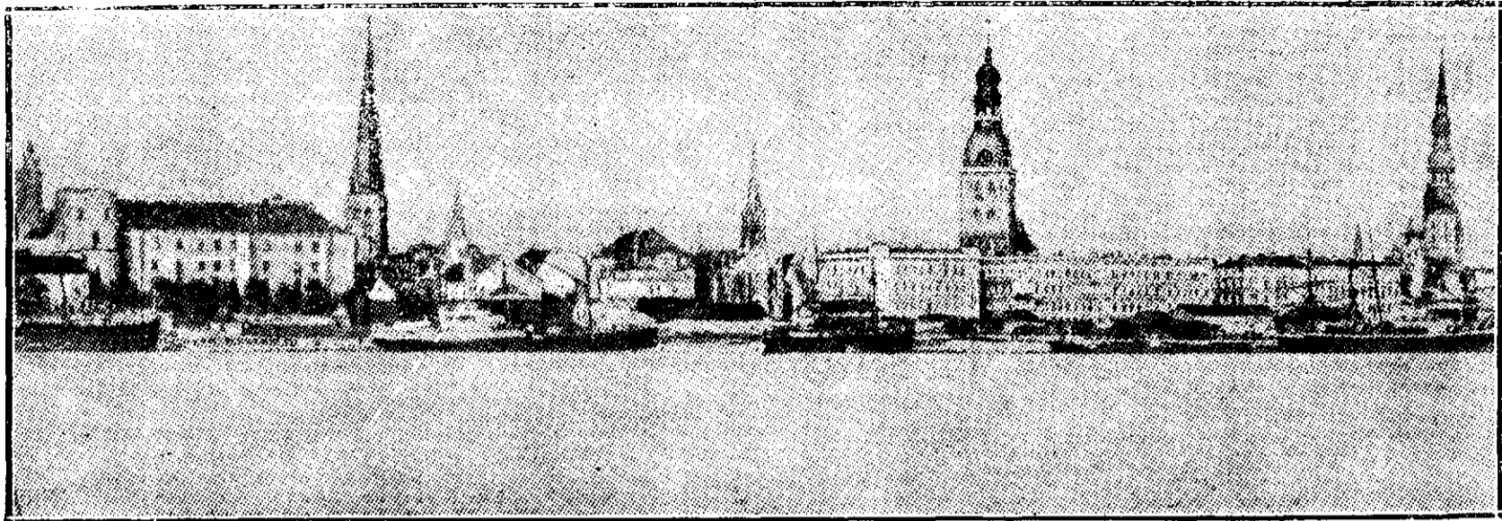
Vederea generală a oraşului Riga, care e ameninţat de armatele germane.