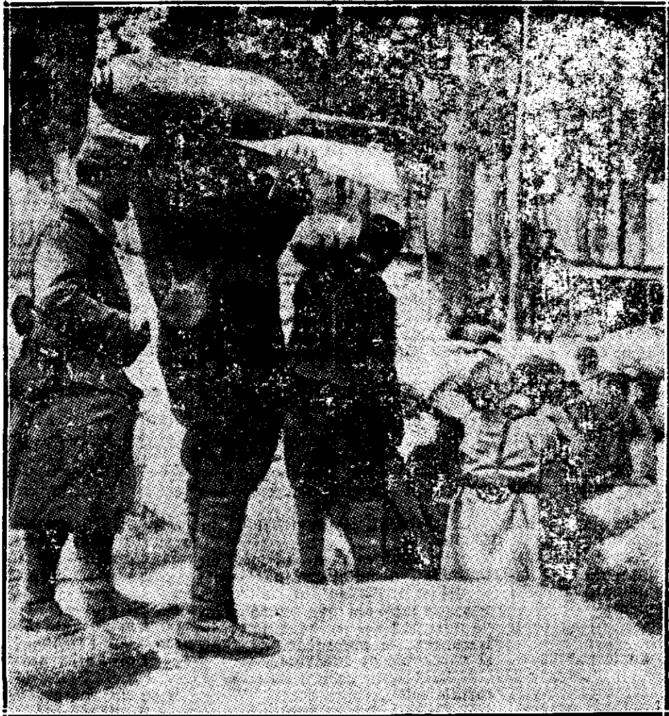
În tranșeele franceze. Transportarea bombelor ce cântărește fie-care 50 kgr.

răspunză; apoi pornea iar în lumea ei de gânduri.