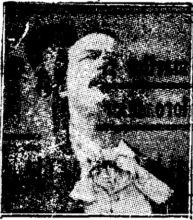
Celebrul pianist polonez Paderewski, care în prezent e în America, unde face propagandă pentru patria sa.

D-nul comandant al regimentului procedo imediat împreună cu toți ofițerii la împărțirea secțiilor în 7 secțiuni, dintre care