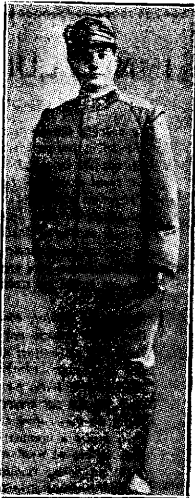
O tânără italiană, care s'a travestit ca bărbat, pentru a se însura ca militar

— Și iată mai încolo un coridor întunecos și apoi perețele pe jumă-