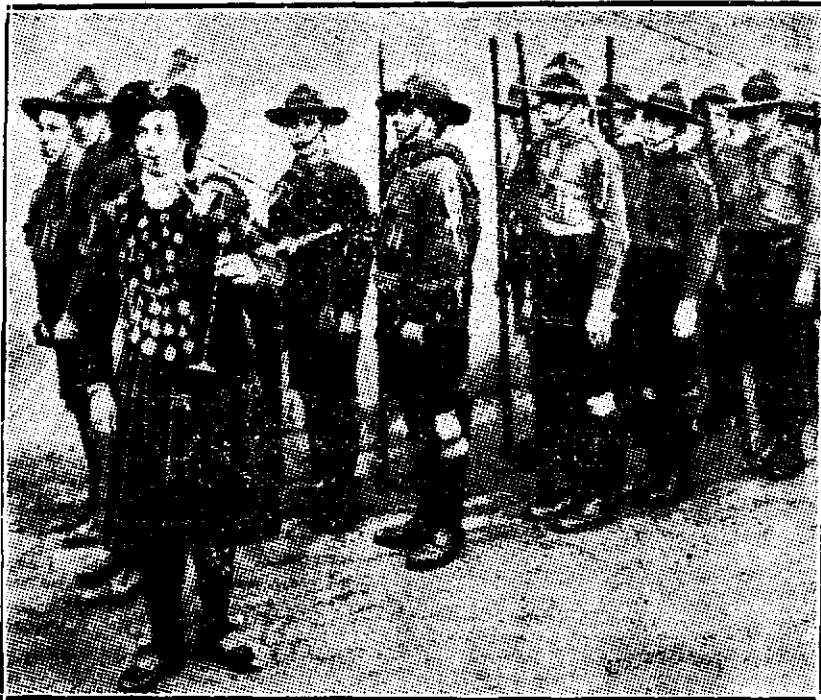
O scoțiană care știe să cânte din cimpoi, în capul cercetașilor din Londra, face propagandă pentru recrutarea soldaților

...Adineauri, am părăsit fotoliul în care îmi trec toată vremea citind și m'am dus la fereastră. Strada-i pustie, ninge într'una și lună nu-i... O, unde's nopțile de primăvară, și visurile și nădejțile mele toate?..