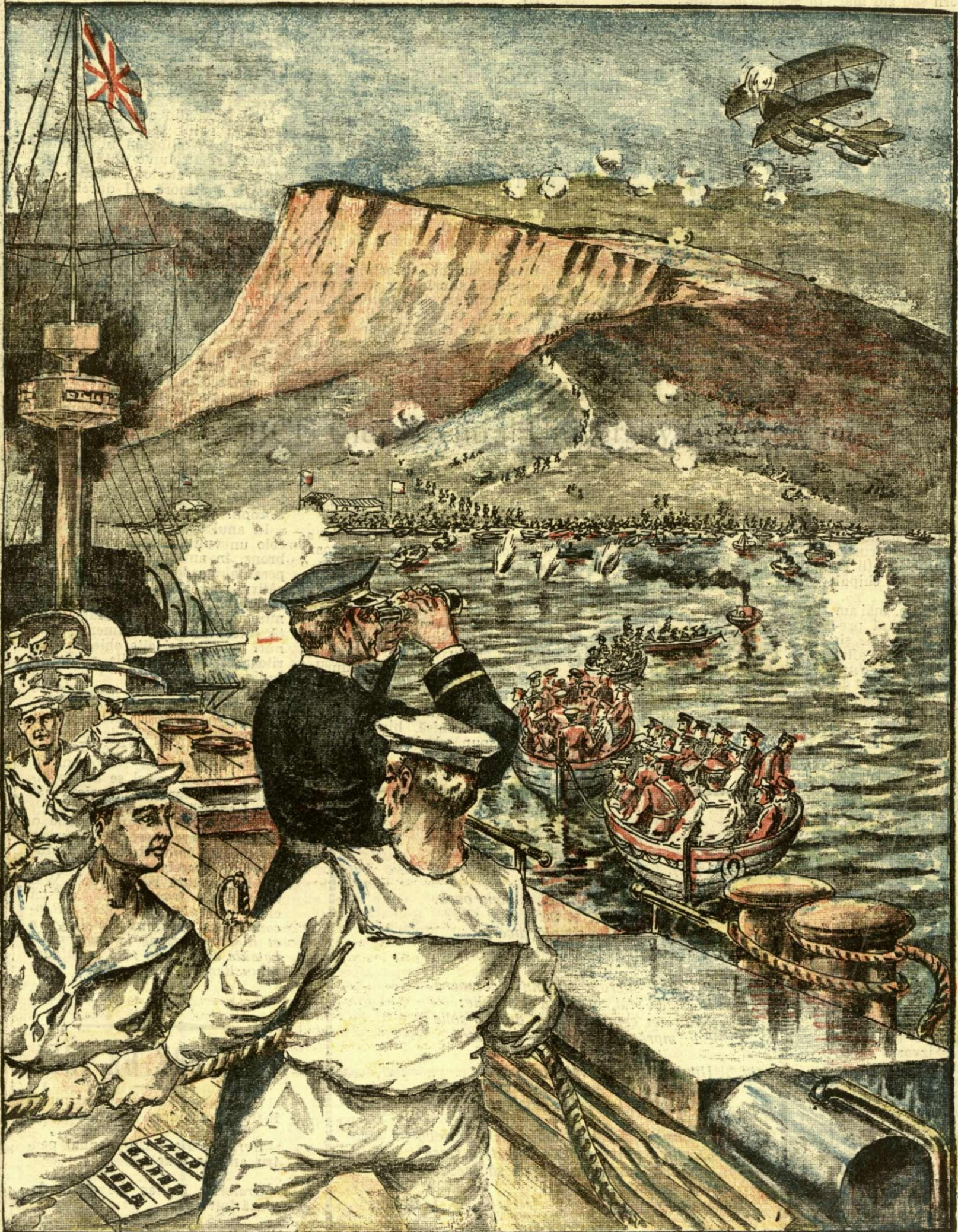
Debarcarea trupelor aliaților la Gallipoli (Turcia)

ANUNCIURI Linia pe pag. 7 și 8 - BANI 20 -