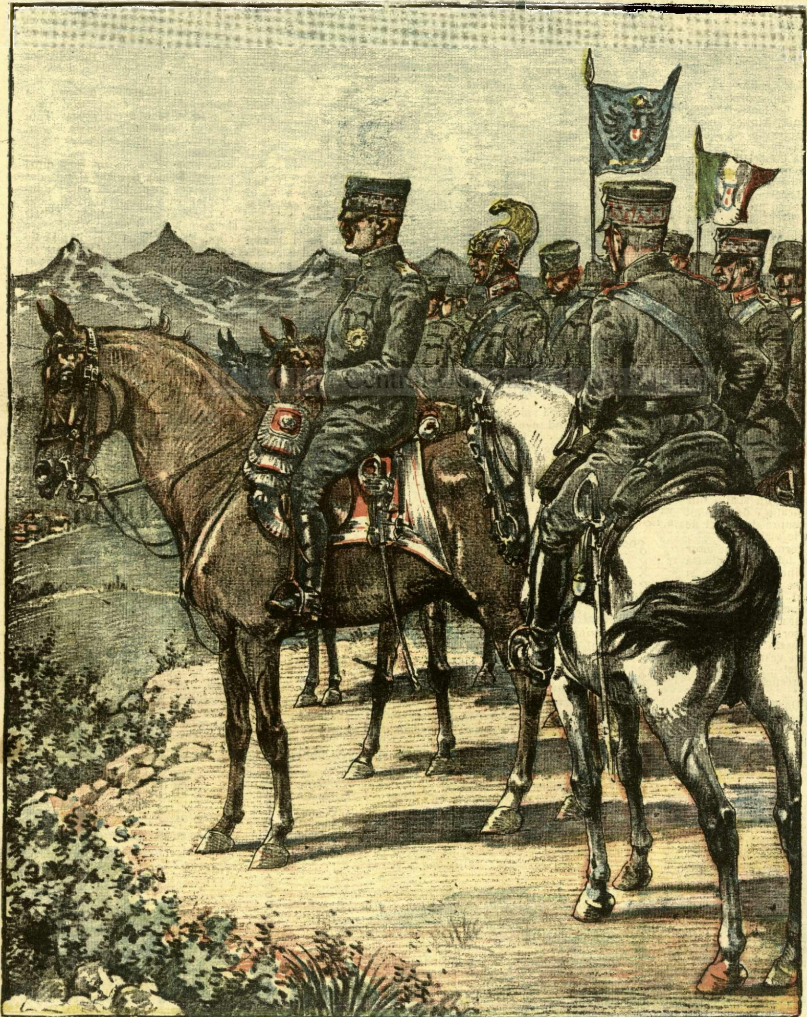
M. S. Regele Victor Emanoel pe câmpul de luptă.

ANUNCIURI Linia pe pag. 7 și 8 -BANI 20-