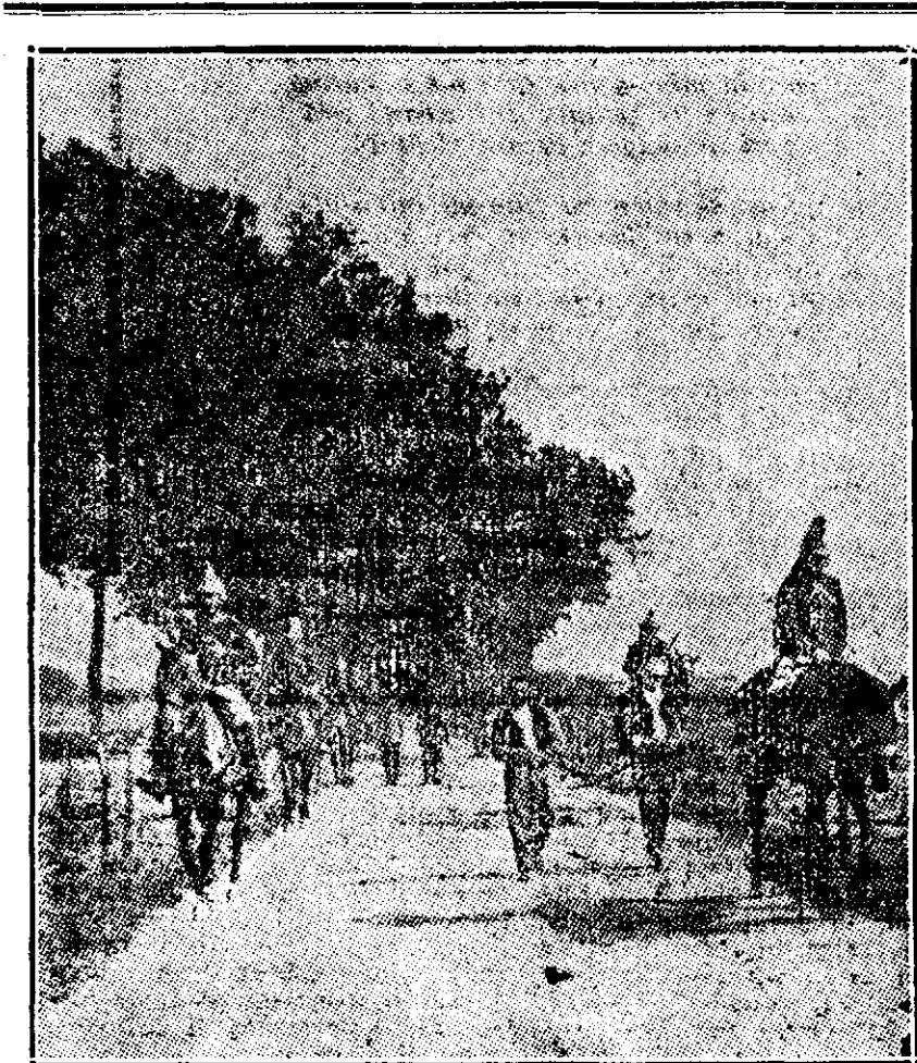
Arestarea a doi spioni cari prin semnale convenționale dirijau focul bateriilor germane. Ei au fost judecați și împușcați pentru fapta lor mizerabilă.