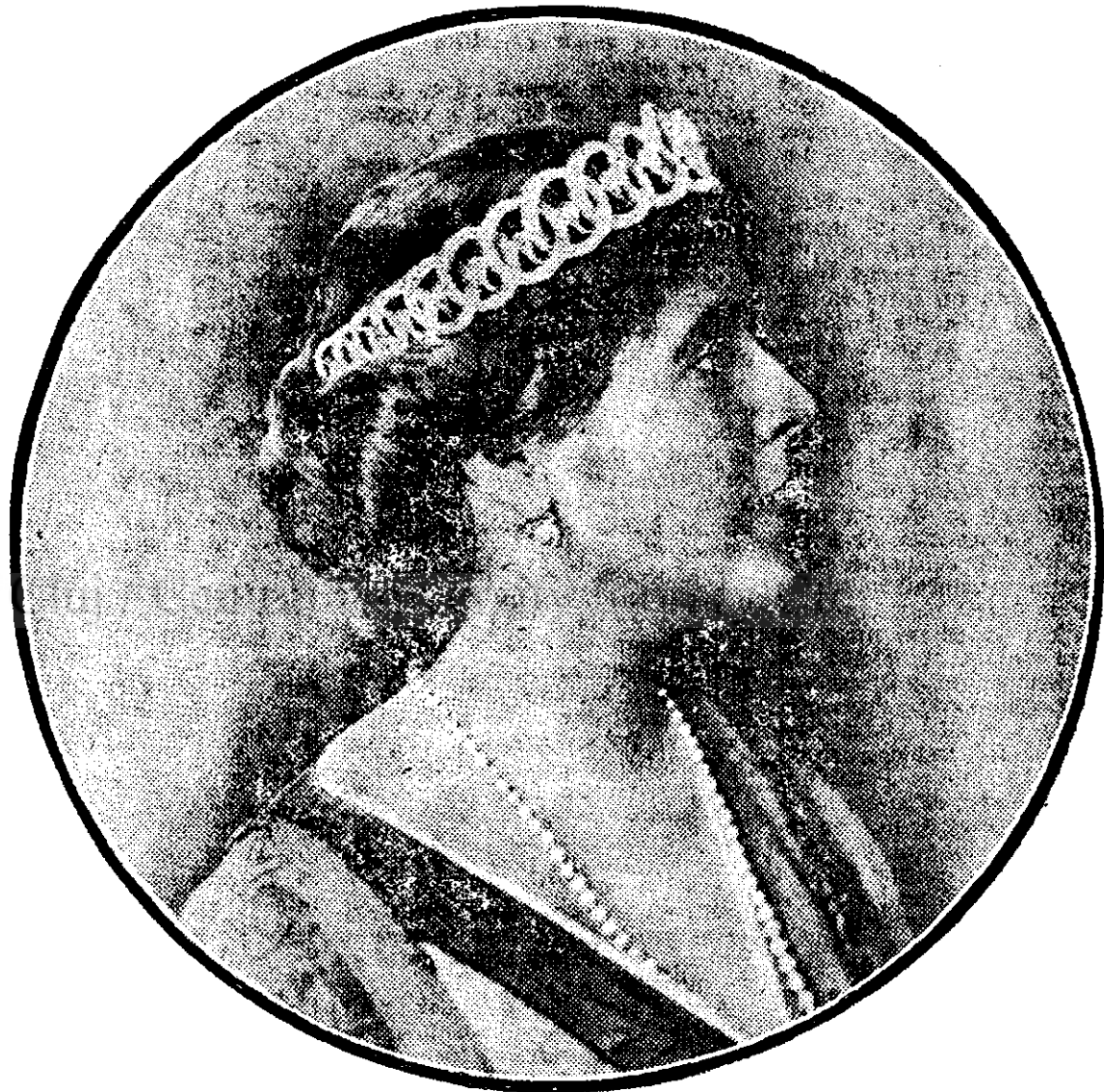
M. S. REGINA MARIA

„Se uită în sus, și văzu nesfârșite cârduri de lebede albe, iar zburând în cercuri pe deasupra