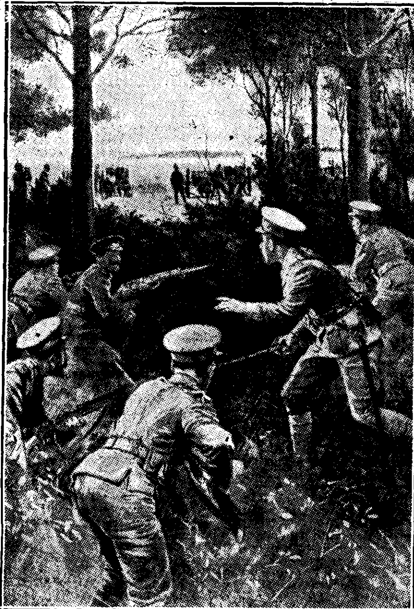
Un detașament englez luând fără veste poziție la spatele unei baterii germane o capturează.

Deodată, în clipa când i se păru că o adiere o târâște în sufletul de roze pe drumul ușor pe care plopii o salută și firele de iarbă