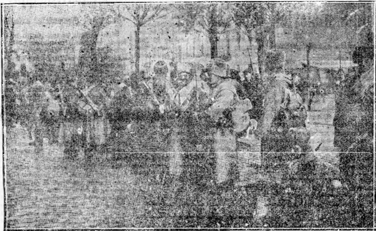
UN REGIMENT SIBERIAN IN VARȘOVIA