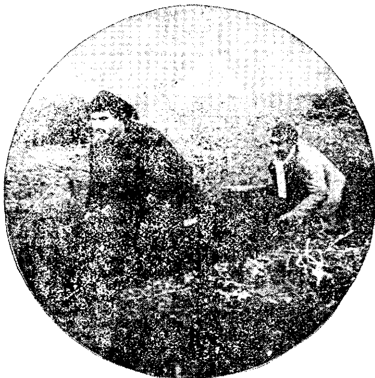
Paupă de zuavi