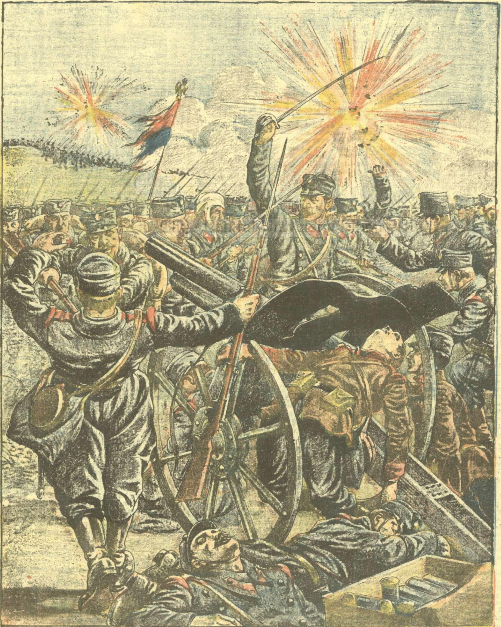
Crancena lupta de la Vanievo între sârvi și austriaci.

ANUNCIURI Lina pe pagina 7 și 8 — BANI 20 —