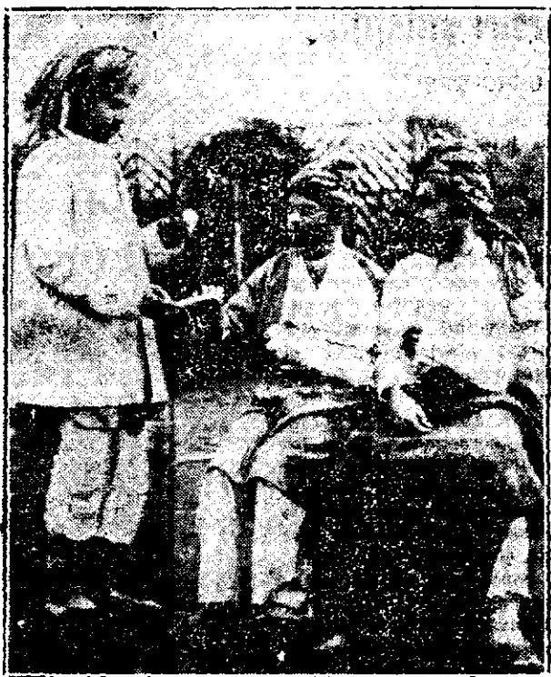
Soldatii indieni raniti