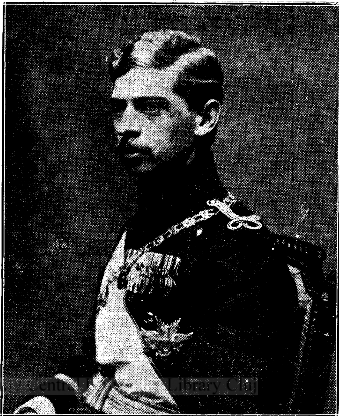
A. S. R. Principele Carol, după cea mai recentă fotografie

Sfârșesc adresându-mă părinților: Trimeteți pe copiii voștri să se înscrie printre cercetași. Nu vor fi trimiși în lupte, nu vor răci făcând e-