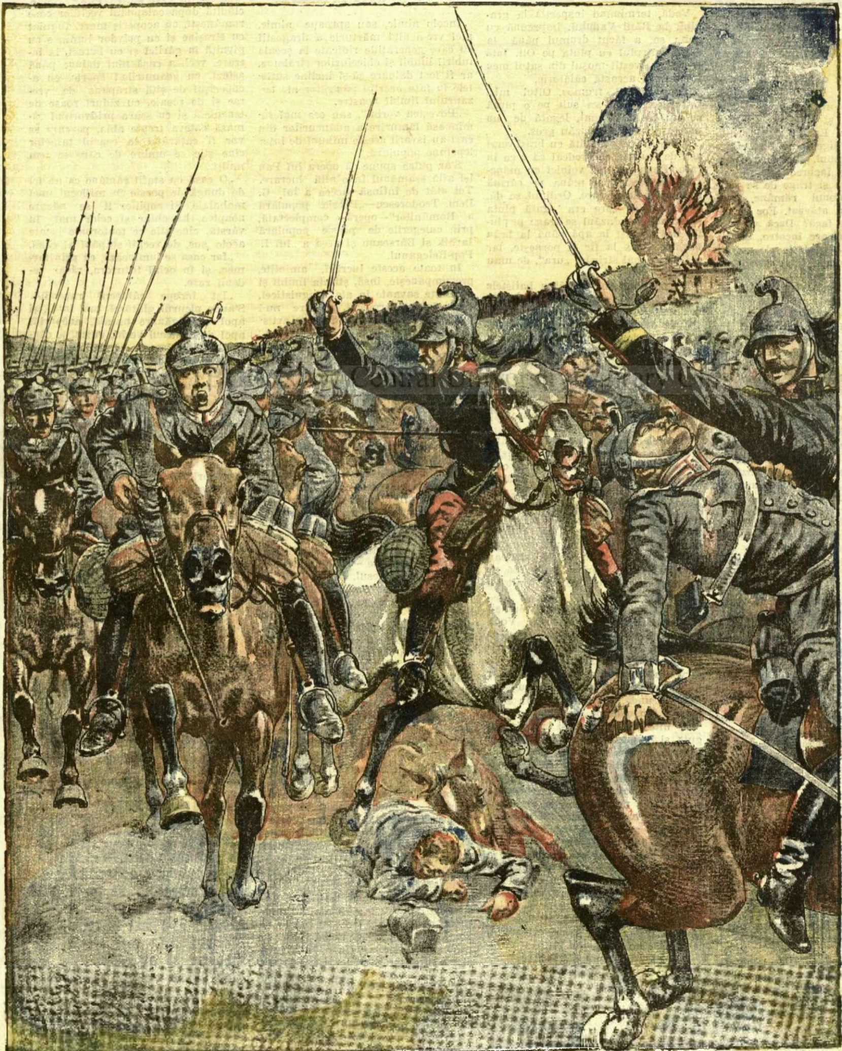
Ulanii șarjați și înfrânți la Ypres de cavaleria franceză

ANUNCIURI Linia pe pagina 7 și 8 - BANI 20 -