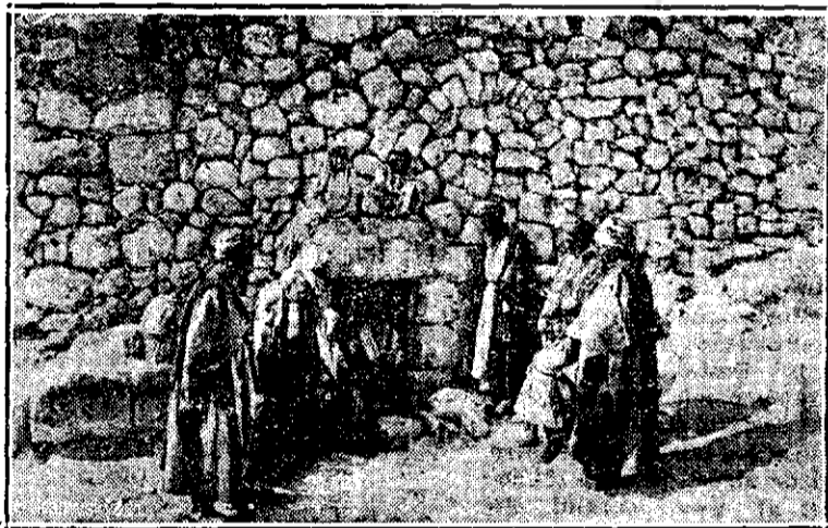
Mormântul lui Lazăr