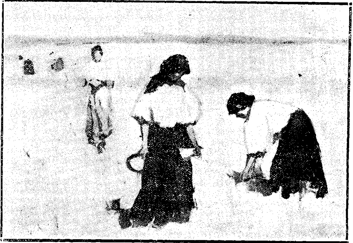
„LA SECERĂ“, de Rodica Maniu