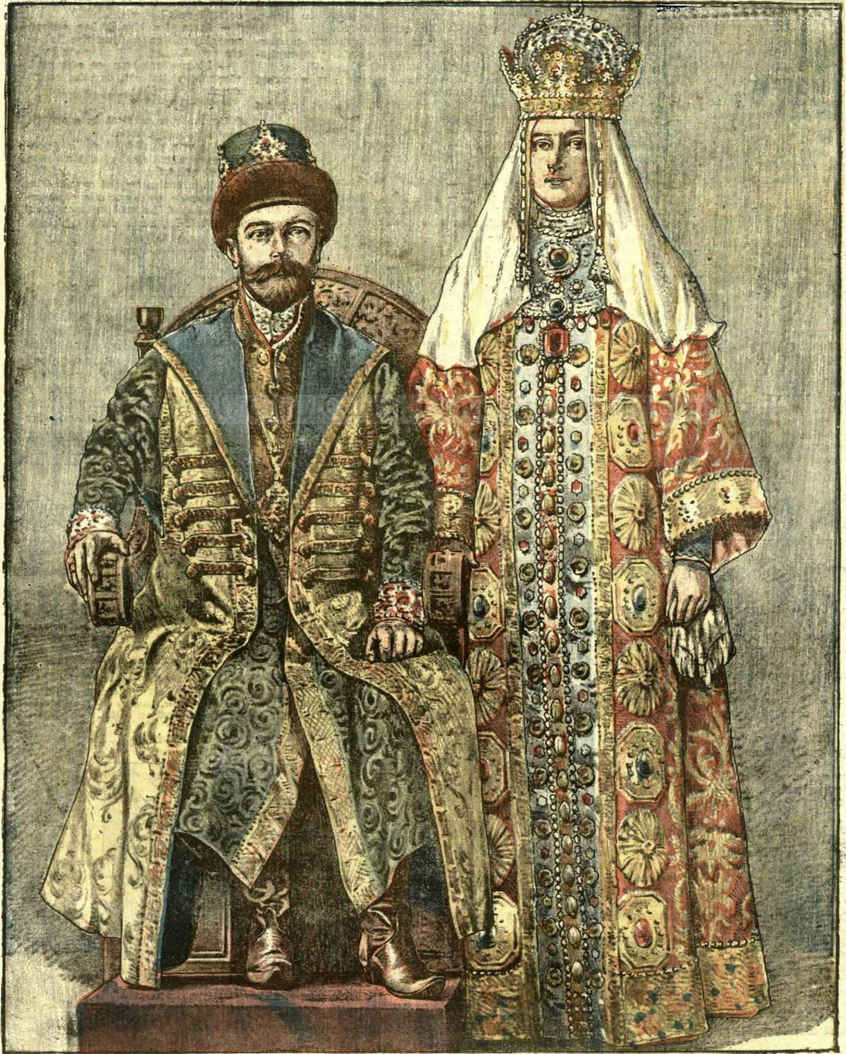
Perechea imperială rusă în portul vechi'or Tarî și Tarine.

ANUNCIURI Linia pe pagina 7 și 8 — BANI 20 —