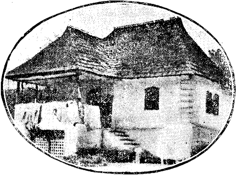
Casă țărănească din Pietrari (Vâlcea)