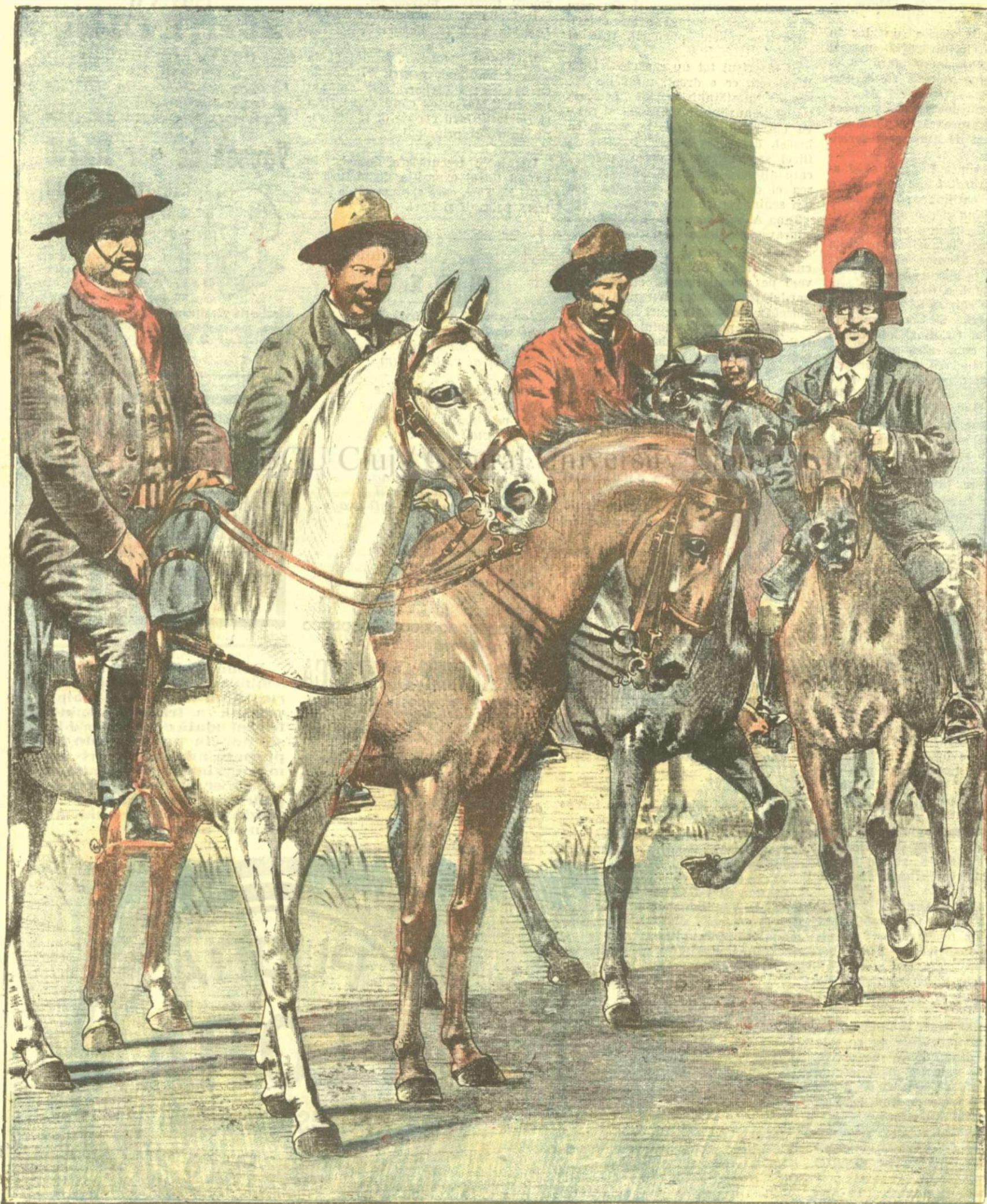
Șefii revoluționarilor mexicani, dela stânga la dreapta, generalii: VERRO, VILLA, ORTEGA și MEZAL

ANUNCIURI Linia pe pagina 7 și 8 - BANI 20 -