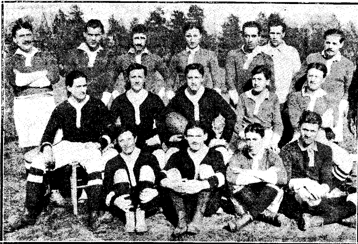
Un grup de jucători ai Fot-balului

De un foarte scurt timp Capitala noastră numără mai multe cluburi, cu mai multe echipe, care practică rugby-ul.