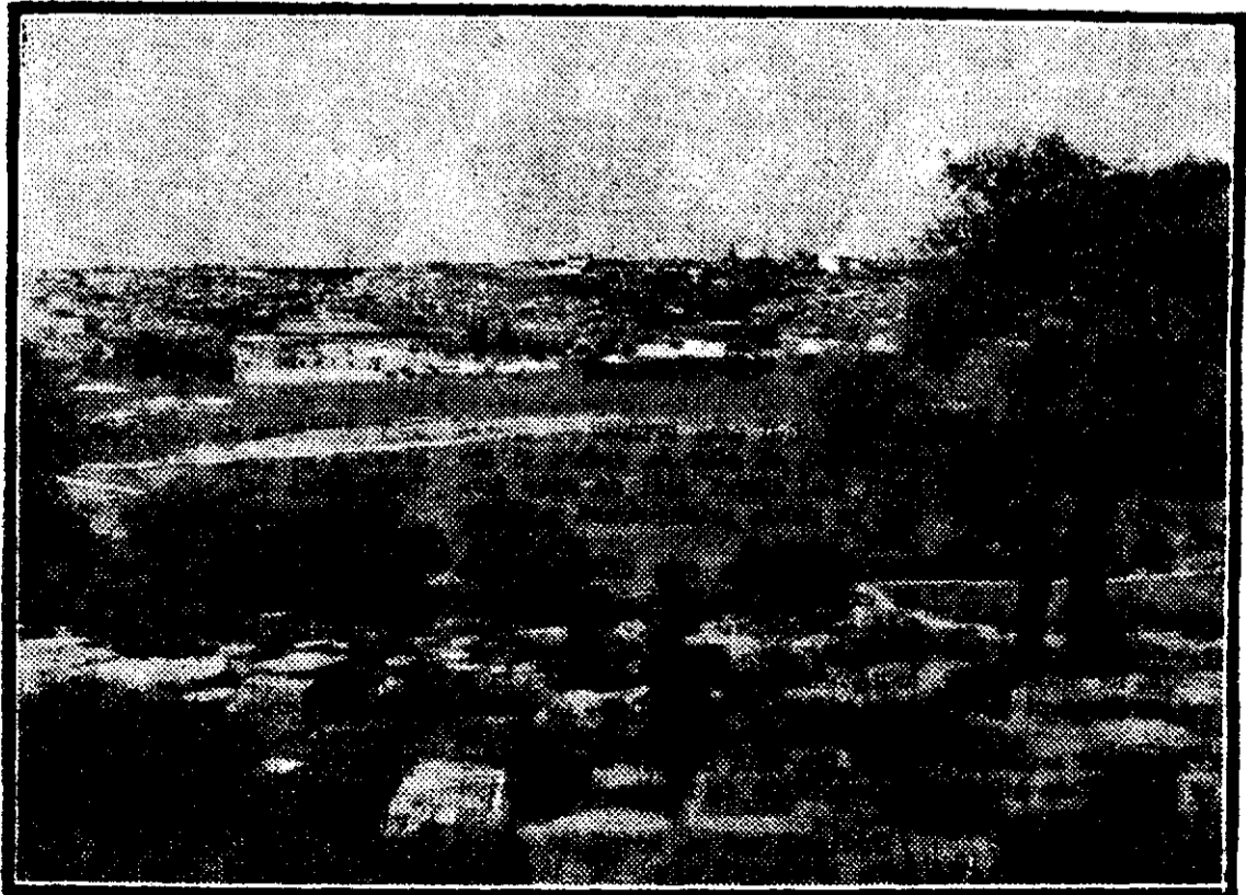
Vederi luate de pe muntele Maslinilor