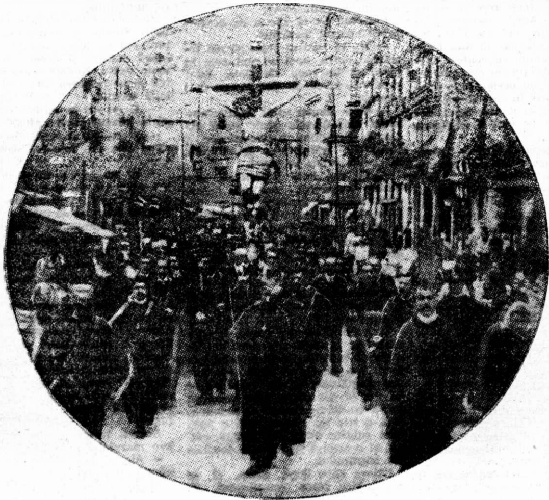
O procesiune în Barcelona

dreptul în răi. Și ziceau oamenii, că de și jidovul nu era botezat, dar crezând în Hristos, anume D-zeu a făcut să moară în noaptea de Înviere, doar i-a ierta păcatele. Jidovii habotnici din târg, ziceau că anume l'a luat D-zeu în noaptea ceea, ca drept pedeapsă și pildă și pentru alții să nu facă ce-a făcut el.