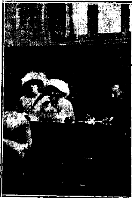
M. S. Regina prezidând o ședință a societății pentru ajutorarea familiilor luptătorilor

Pavilionul are o terasă care domină marea și în fața căruia se întinde imponenta și fermecătoarea priveliște a lămensității.