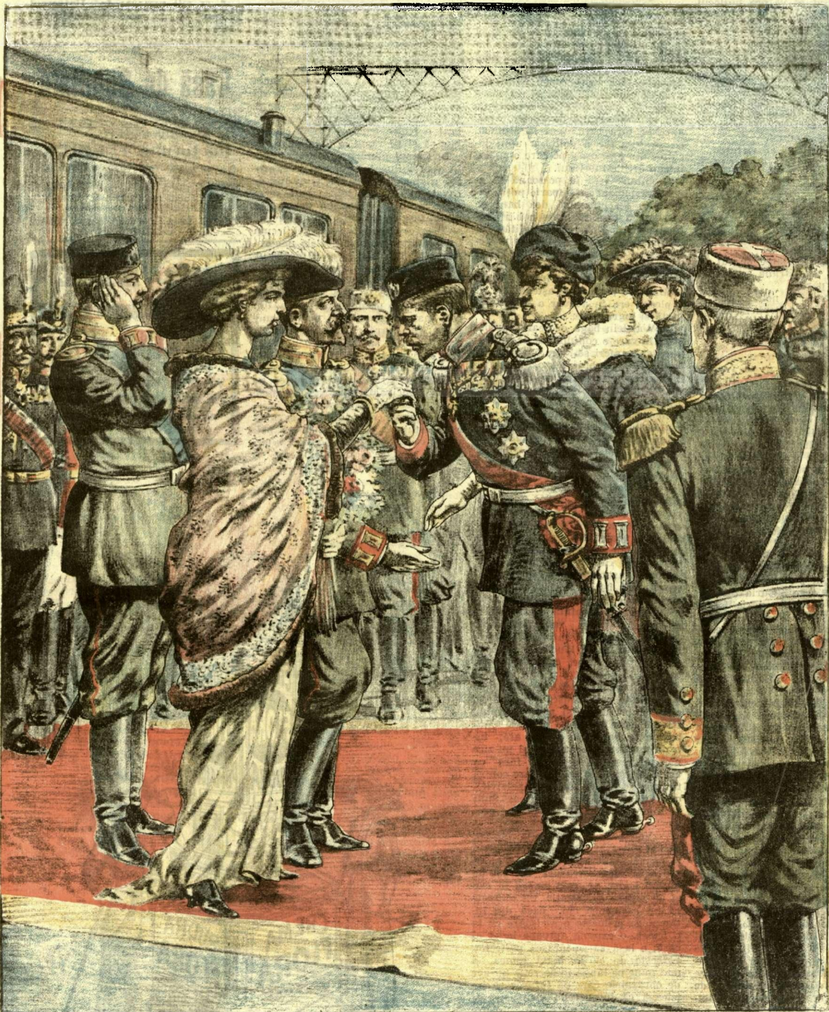
Sosirea Moștenitorilor României la St. Petersburg

ANUNCIURI Linia pe pagina 7 și 8 — BANI 20 —