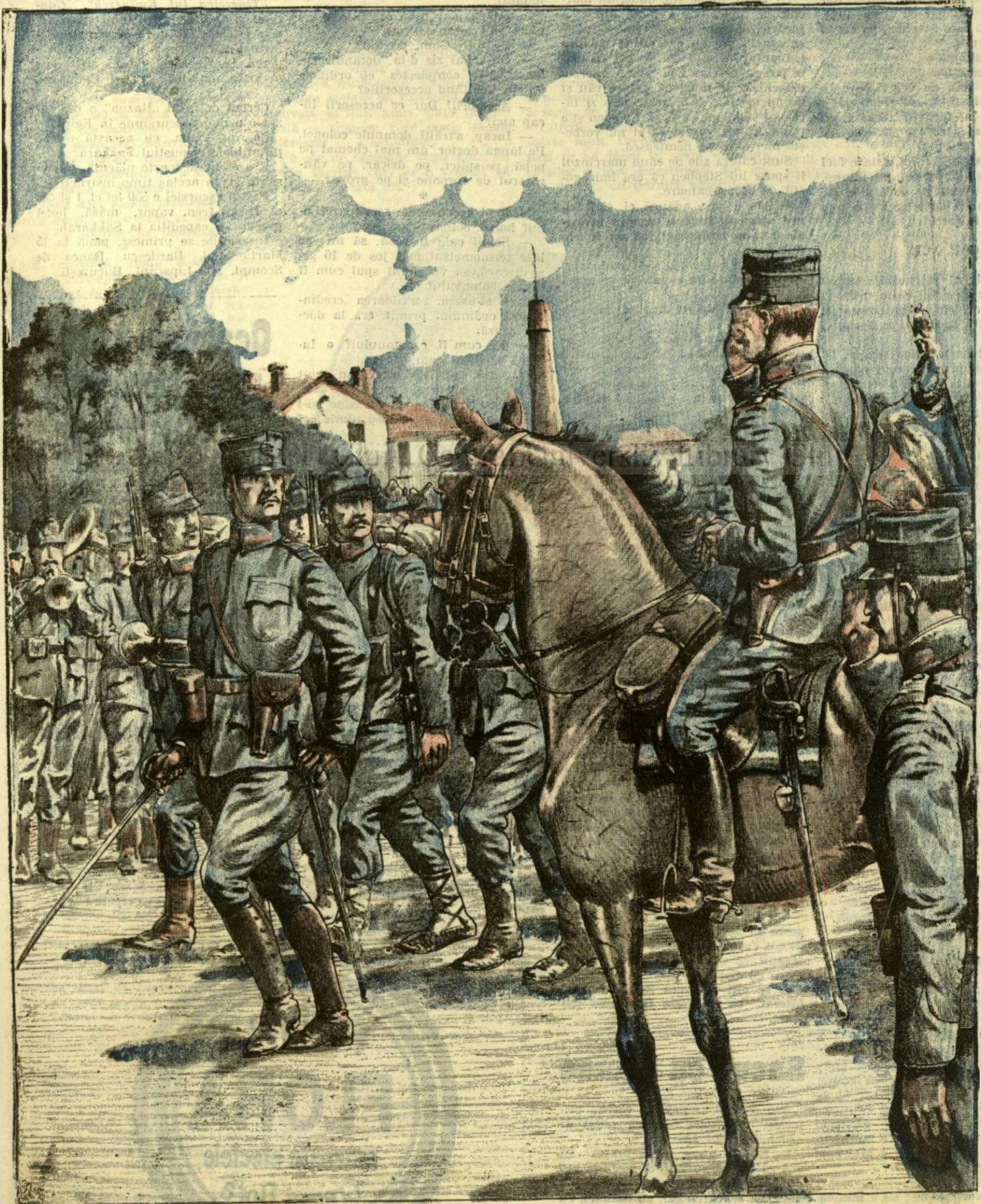
Un episod din timpul campaniei. - (Vezi explicația)

ANUNCIURI Linia pe pagina 7 și 8 — BANI 20 —