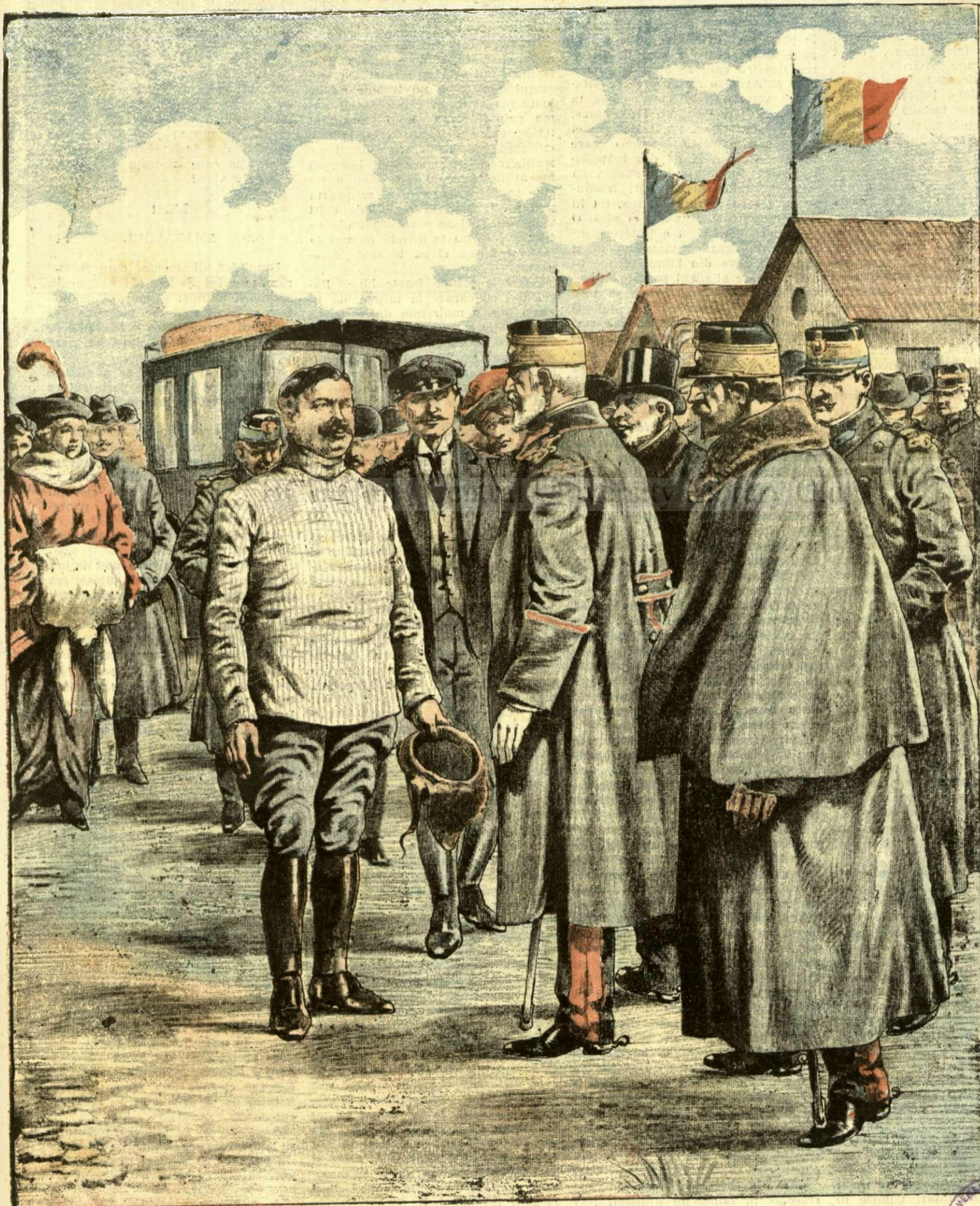
Pégoud, după sbornurile sale, felicitat de M. S. Regele Carol