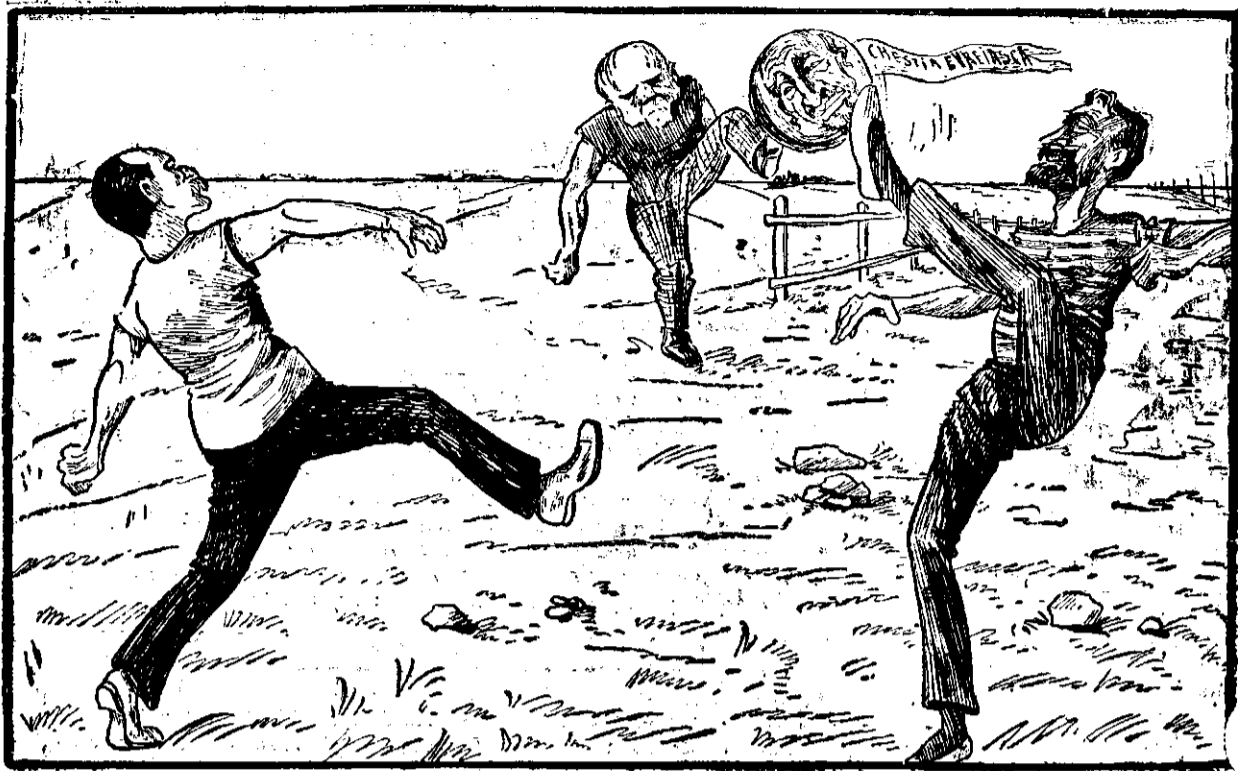
Sport politic care se reia de câte ori această chestie vine în discuție.