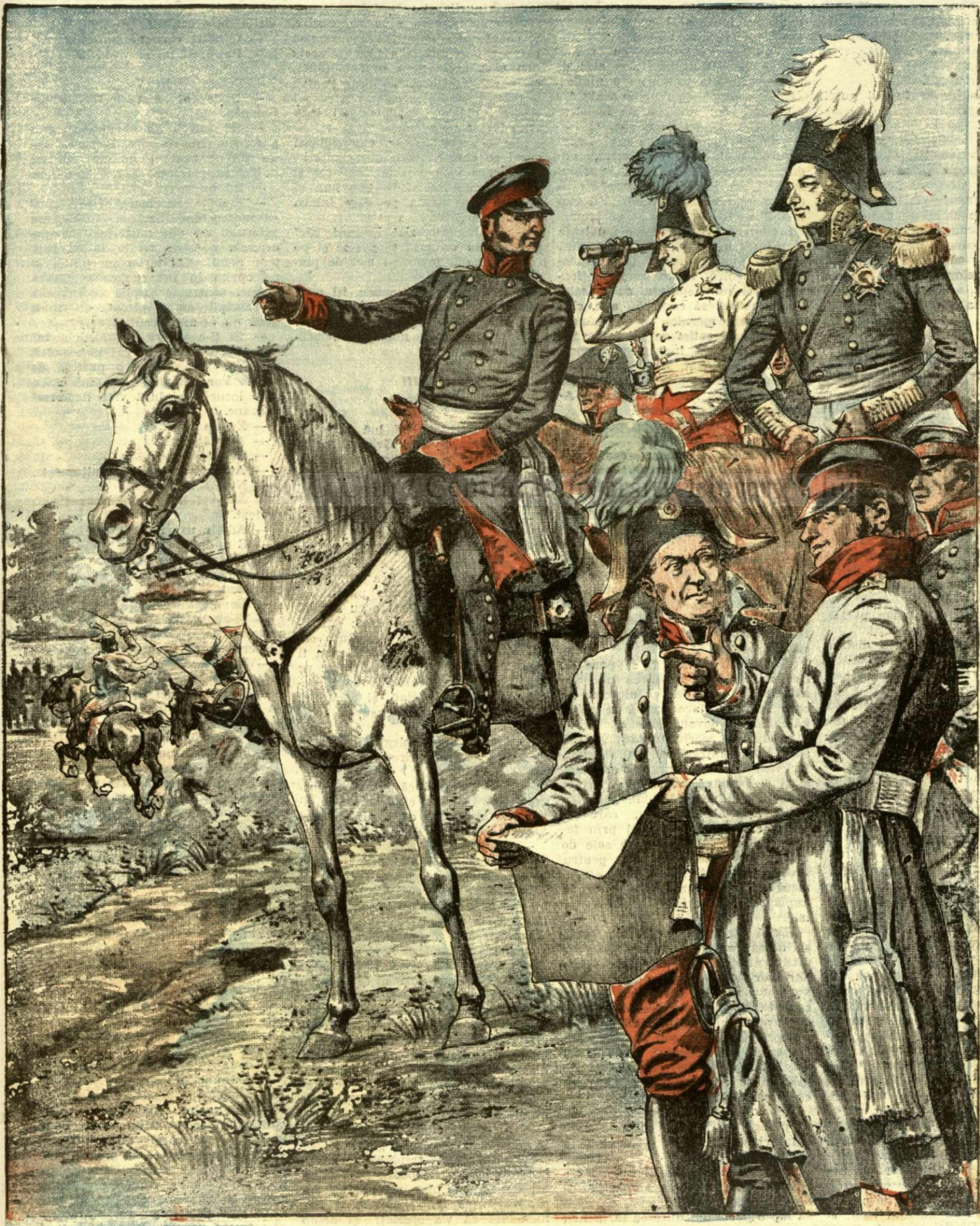
UN EPISOD AL LUPTEI NATIUNILOR.

ANUNCIURI Linia pe pagina 7 și 8 — BANI 20 —