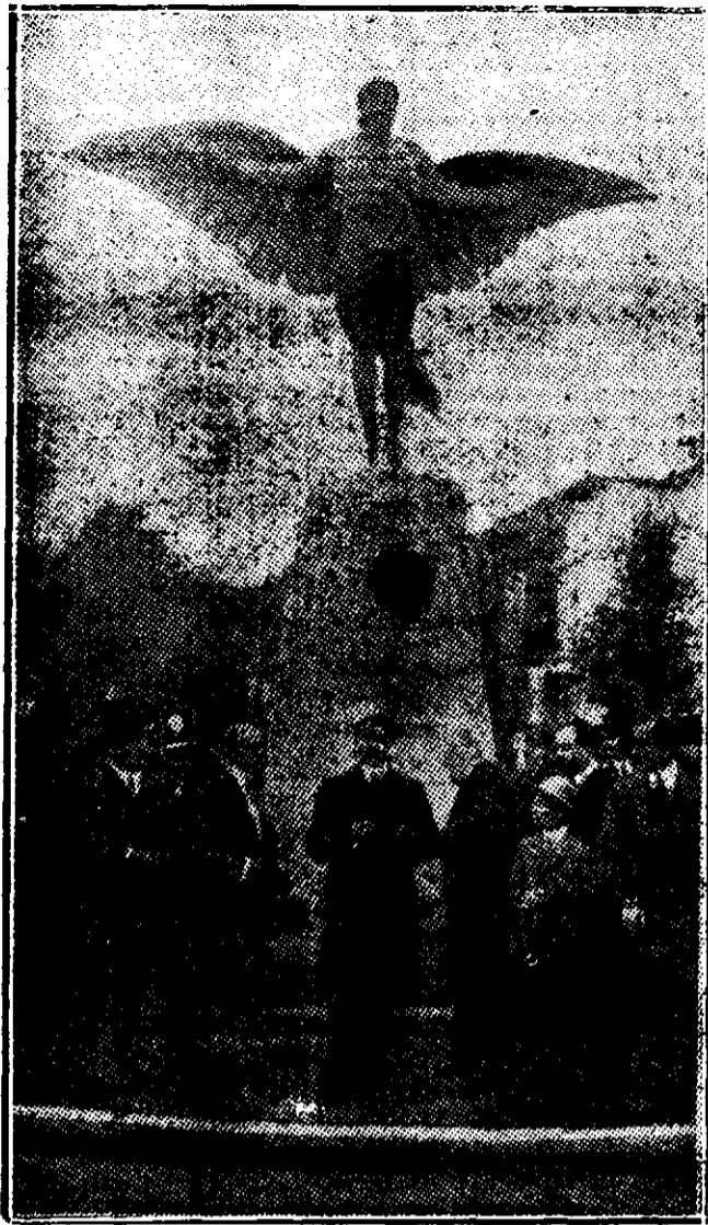
Inaugurarea monumentului lui Santos-Dumont, la 19 Octombrie st. n., pe înălțimea de la St. Cloud.

„Premergătorul navigațiunii aeriene” — Santos-Dumont — a asistat la serbare.