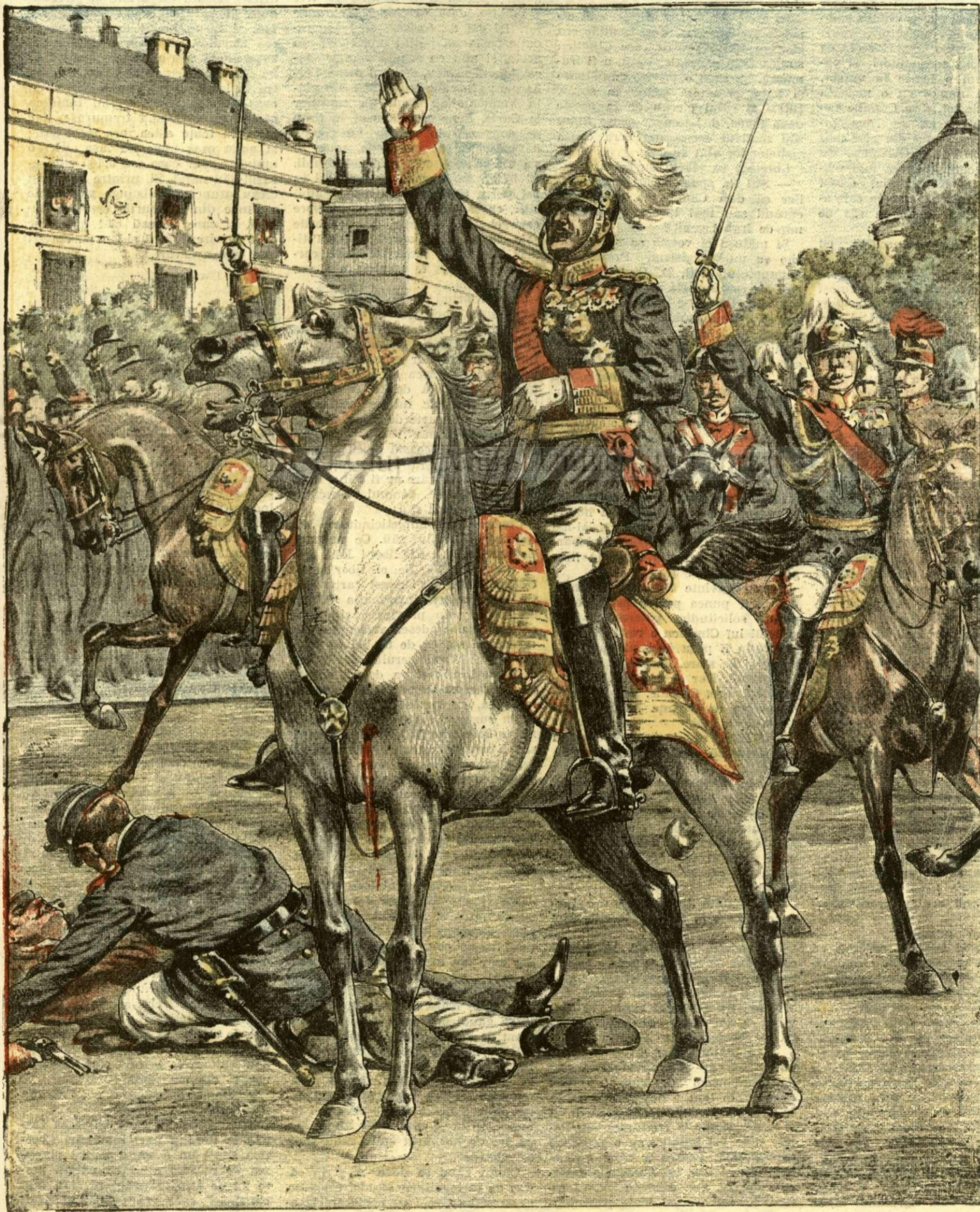
ATENTATUL CONTRA REGELUI ALFONS XIII AL SPANIEI

ANUNCIURI Linia pe pagina 7 și 8 —BANI 20—