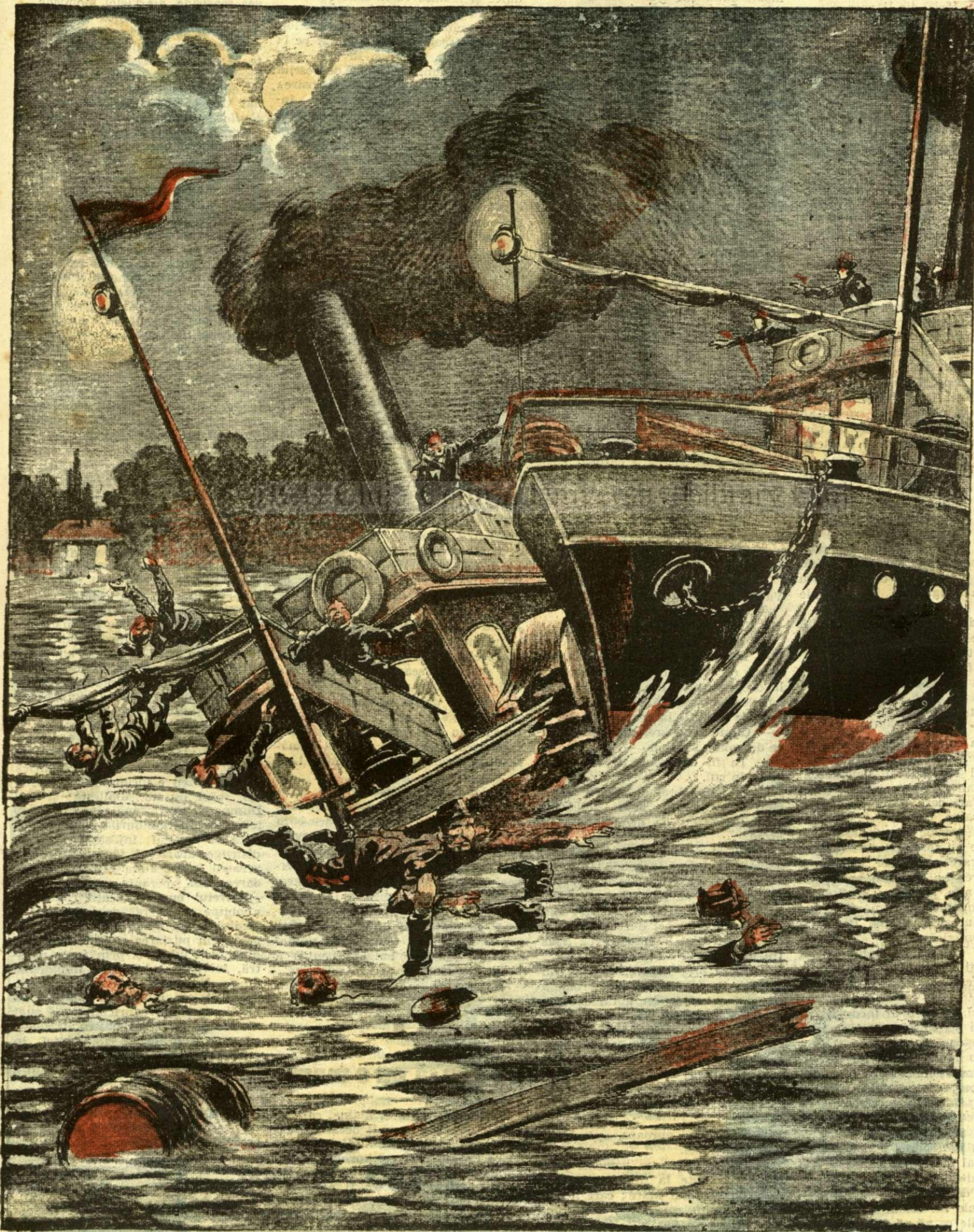
MAREA CATASTROFĂ DE LA HÂRȘOVA. — (Vezi explicația).

ANUNȚURI: — Linia pe pagina 7 și 8 bani 20 —