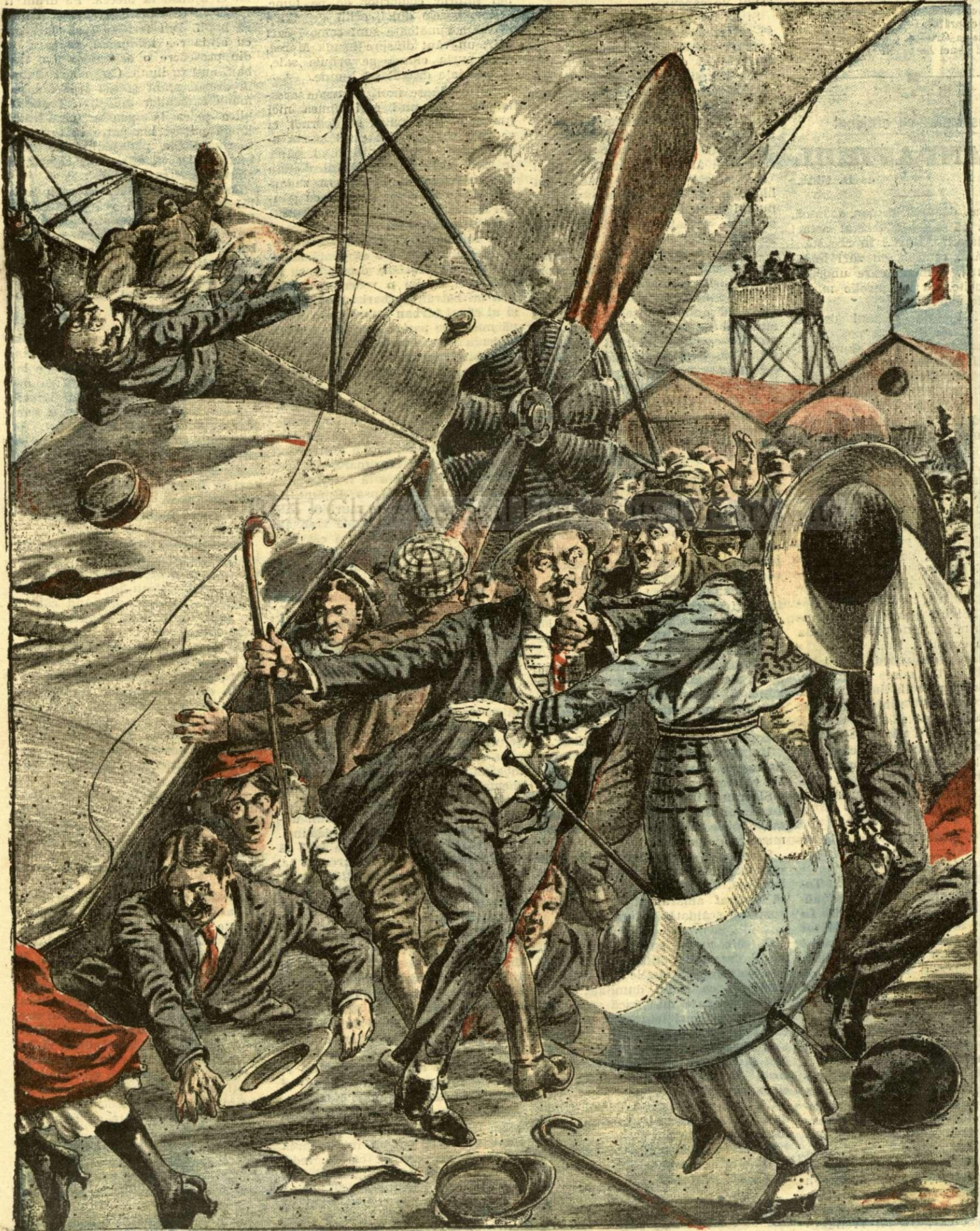
GROAZNICA NENOROCIRE LA O SERBARE DE AVIAȚIUNE. — (Vezi explicația).

ANUNȚURI: — Linia pe pagina 7 și 8 bani 20 —