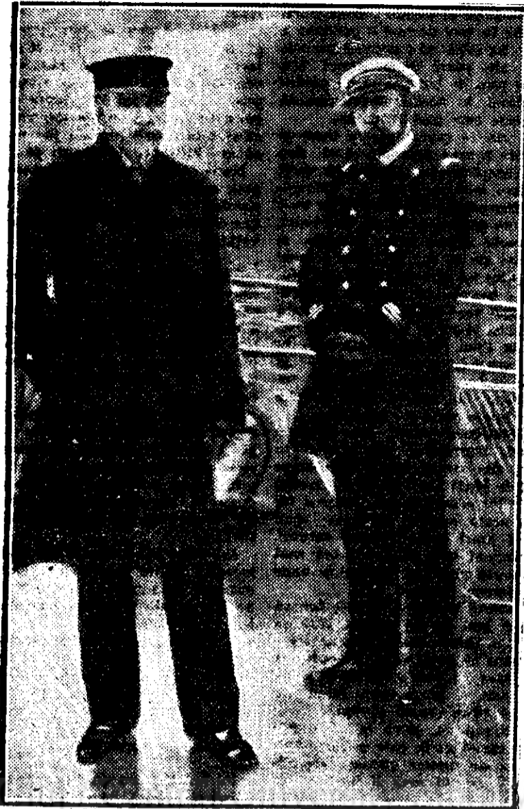
D. Poincaré, președ. consiliului din Franța și comandantul vasului „Condé, pe bord.