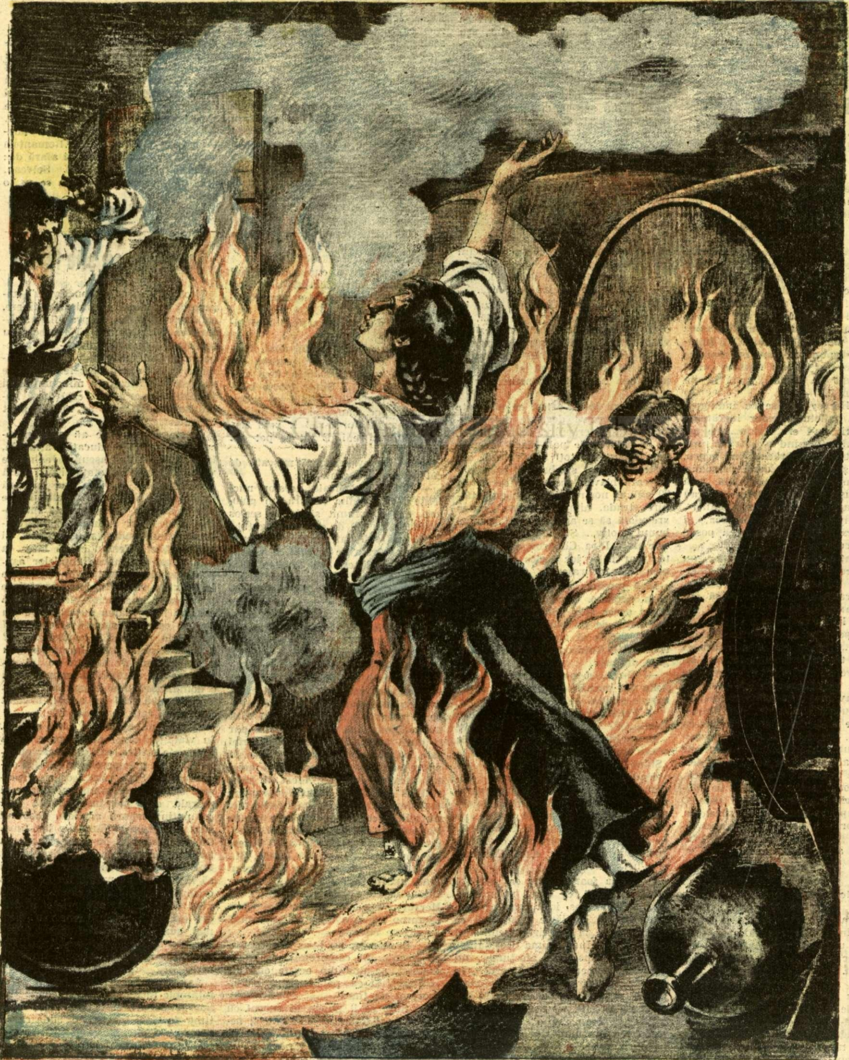
○ FEMEE ȘI UN BĂIAT ARȘI DE VI. — (Vezi explicația).

ANUNȚURI: — Linia pe pagina 7 și 8 bani 20 —