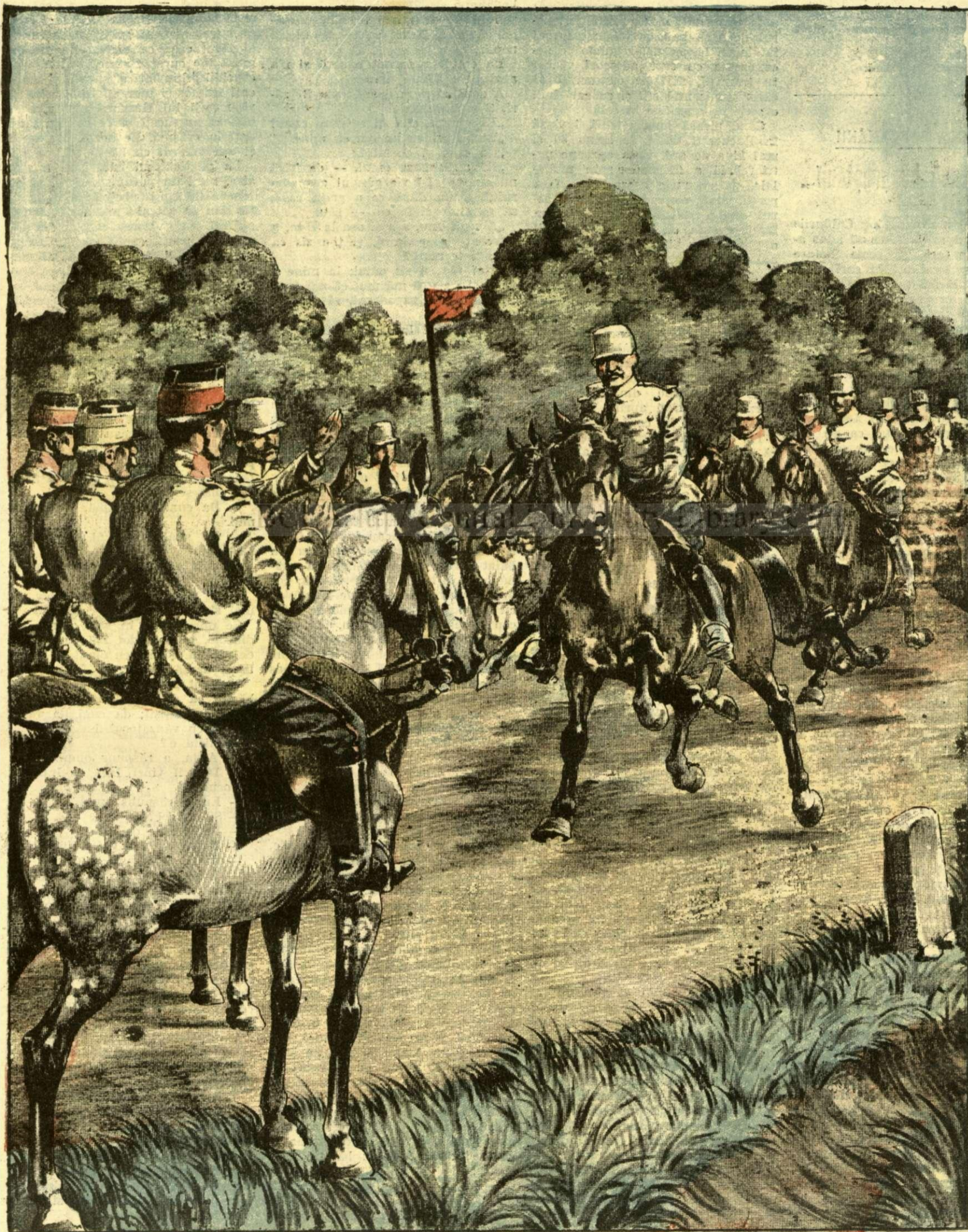
MARSUL DE RESISTENTA CRAIOVA-VÂRCIOROVA. — (Vezi explicația).

ANUNȚURI: — Zăria pe pagină 7 și 8 bani 50 —