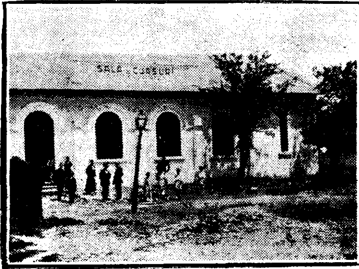
Sala de cursuri, conferințe și spectacole

nă orânduială... Dar nu prea cunosc pricina pentru care m'ați chemat aici; oare spre a da ceva lămuriri despre bucată mea, sau spre a mă învinovăți?