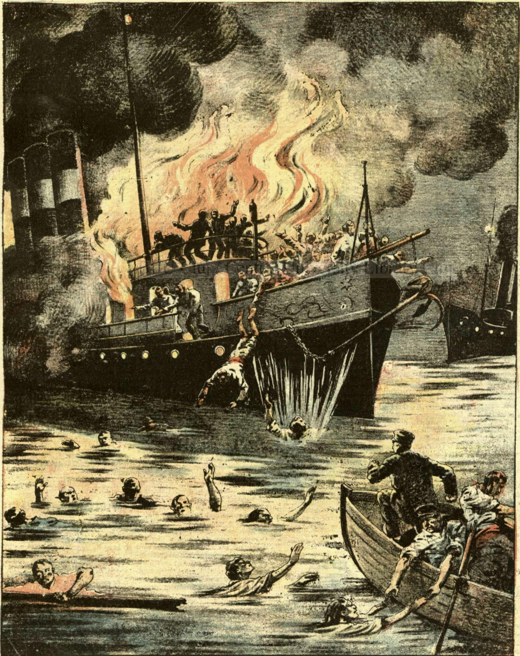
CATASTROFA VAPORULUI «ERZSÉBET KIRALYNE» PE DUNARE. — (Vezi explicație)

ANUNȚURI: — Linia pe pagina 7 și 8 bani 20 —