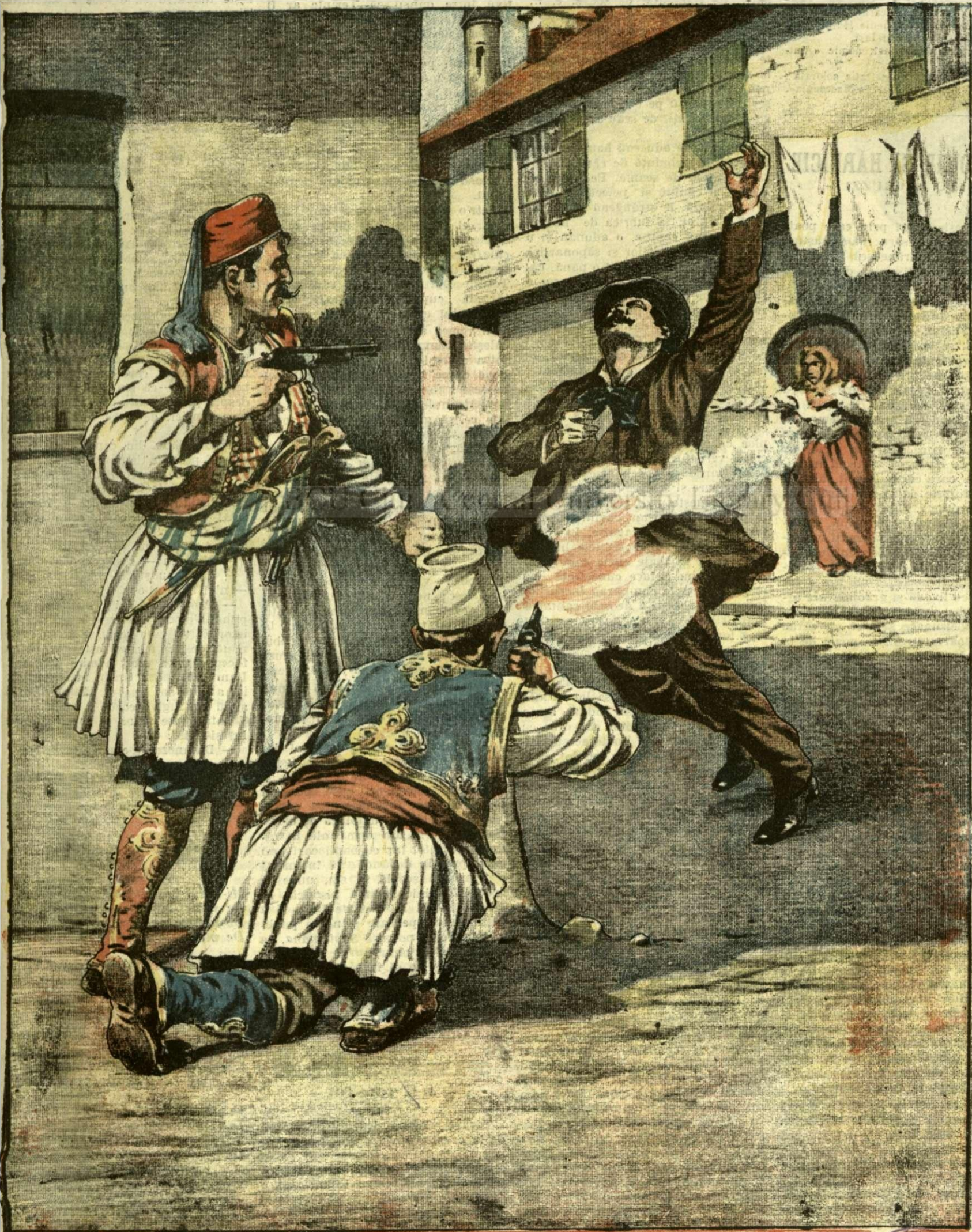
UN INSTITUTOR ROMÂN RĂNIT IN MACEDONIA — (Vezi explicația).

ANUNȚURI: Linia pe pagina 7 și 8 20 bani