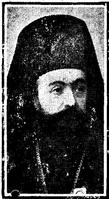
Vicarul St. Mitropolii din Iași

Norocul părea favorabil lui Napoleon. Nelson fu la 19 Mai în mână spre sud din cauza vânturilor, pe când încrucea în fața Toulonului. Astfel Napoleon putu să-și imbarce trupele la Civita-Vecchia și Ajaccio.