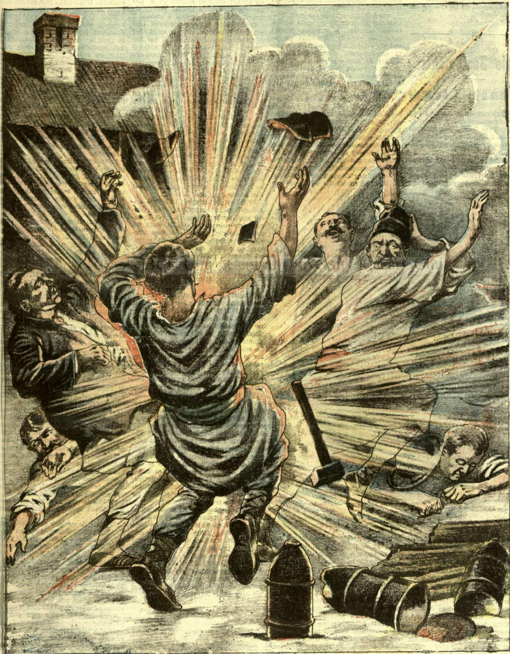
CATASTROFA DIN COMUNA CHIAJNA. — (Vezi explicația)