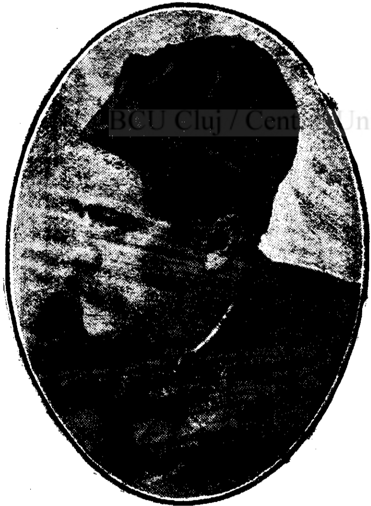
I. L. CARAGIALE

Când deschise ochii raza culcă l-șe pe mână o orbește. Umbre dau nă-vală și-o împresoară ca într'o hațni cernită. Începe iar lucrul. Înce-voasă. Acul înflorite drumul în-urmă, așa se scurtează și abia ajun-ge să încheie o ramură dedesubt