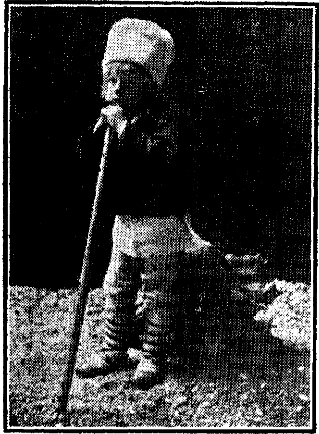
A. S. R. PRINȚUL NICOLAE, ca cioban

Un alt fenomen mă confirmă în această înaltă idee. Trăsăturile feței tatălui meu luaseră, în scriu, un aspect sublim. De ce, acest mister, să nu fie indicele imoralității neas-