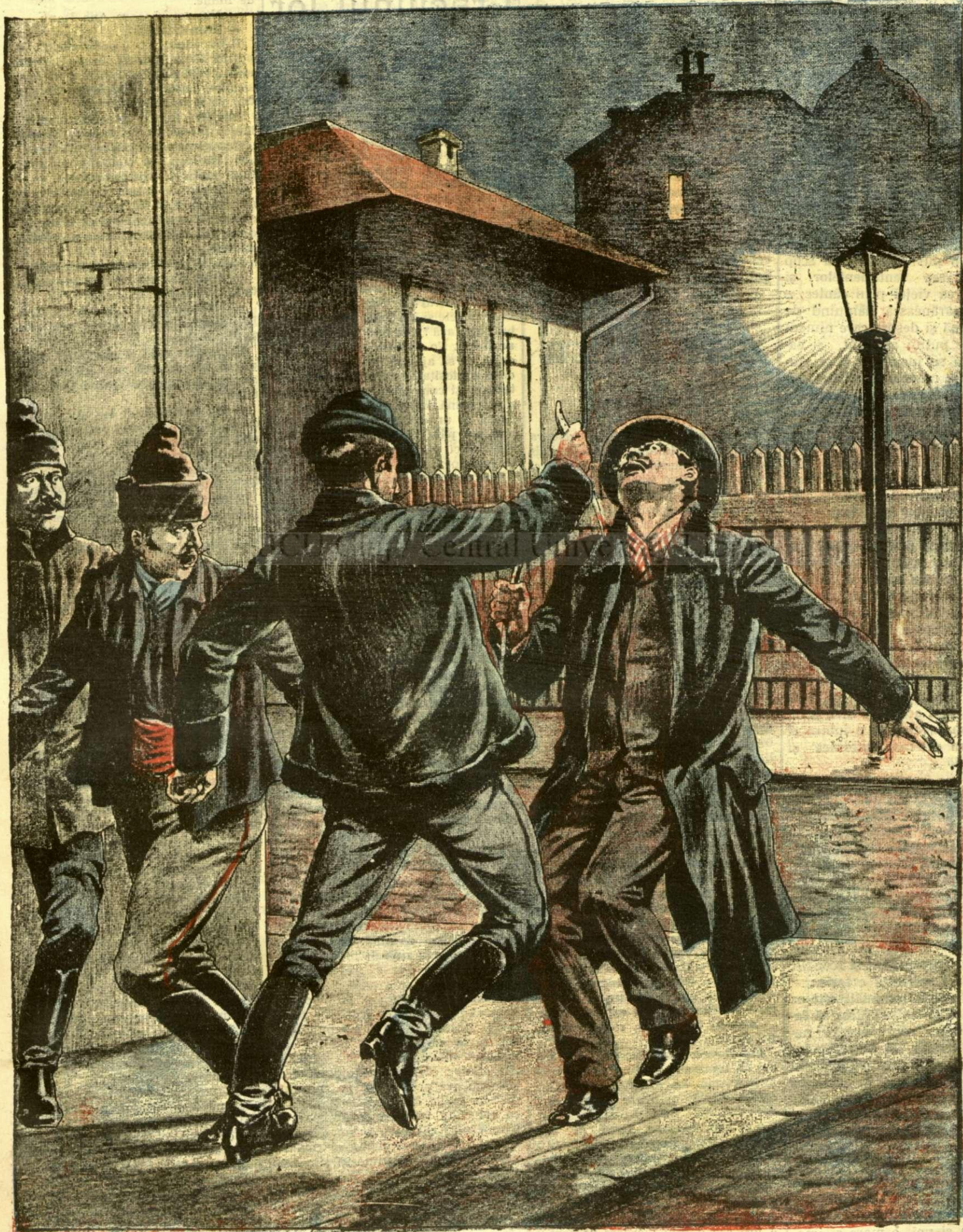
Crîma din strada Bibescu-Vodă din Capitală. — (Vezi explicația)