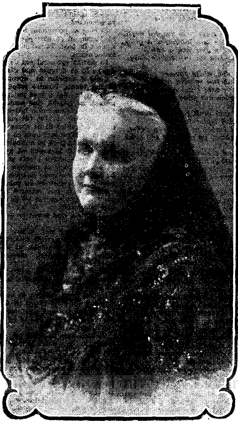
M. S. REGINA ELISAVETA care a implinit la 16 Decembrie cor. 68 de ani.

rașul desfrăului și al luxului nebun, precum și al mizeriei întunecate.