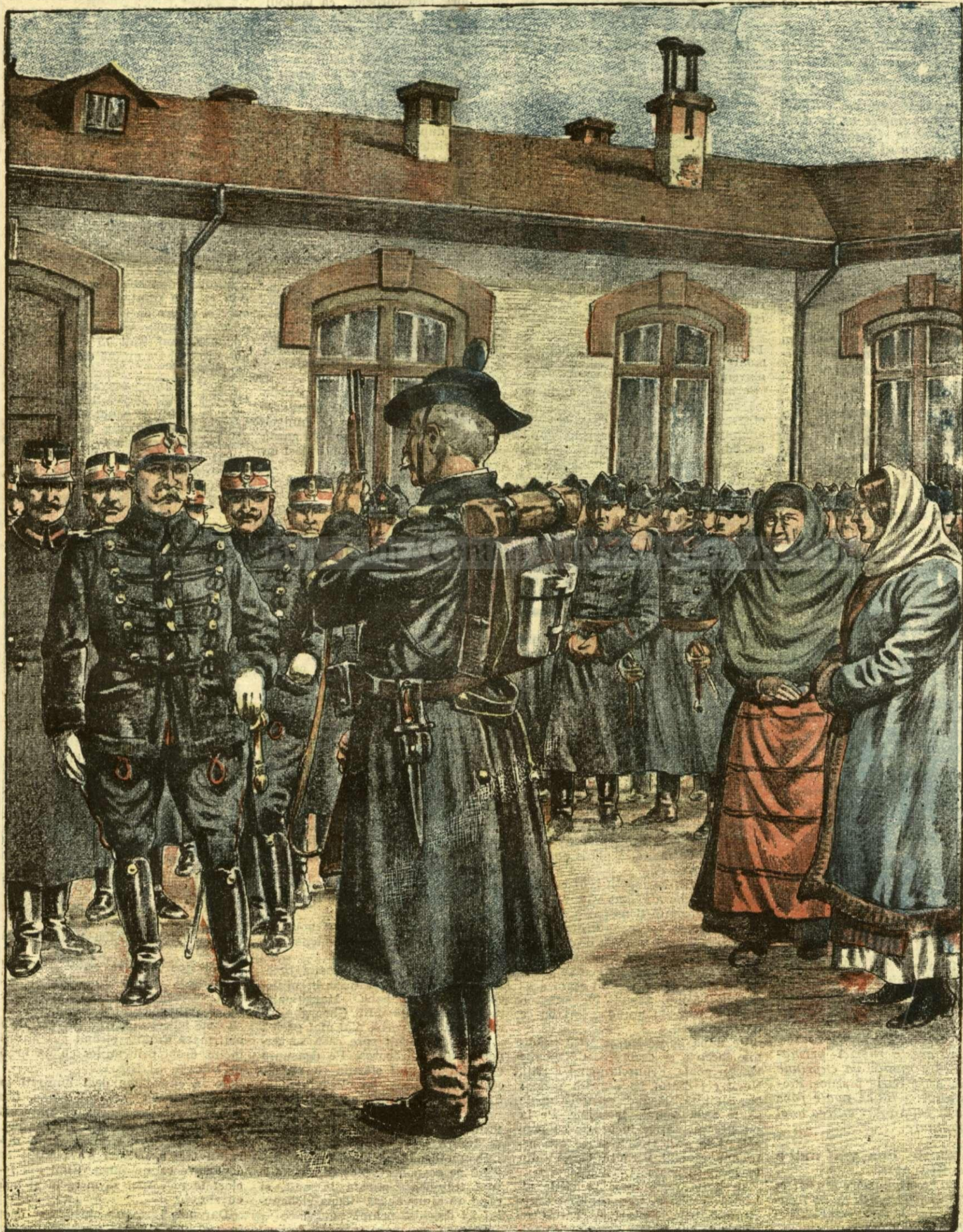
SARBATORIREA EROULUI GRIGORE ION. — (Vezi explicația).