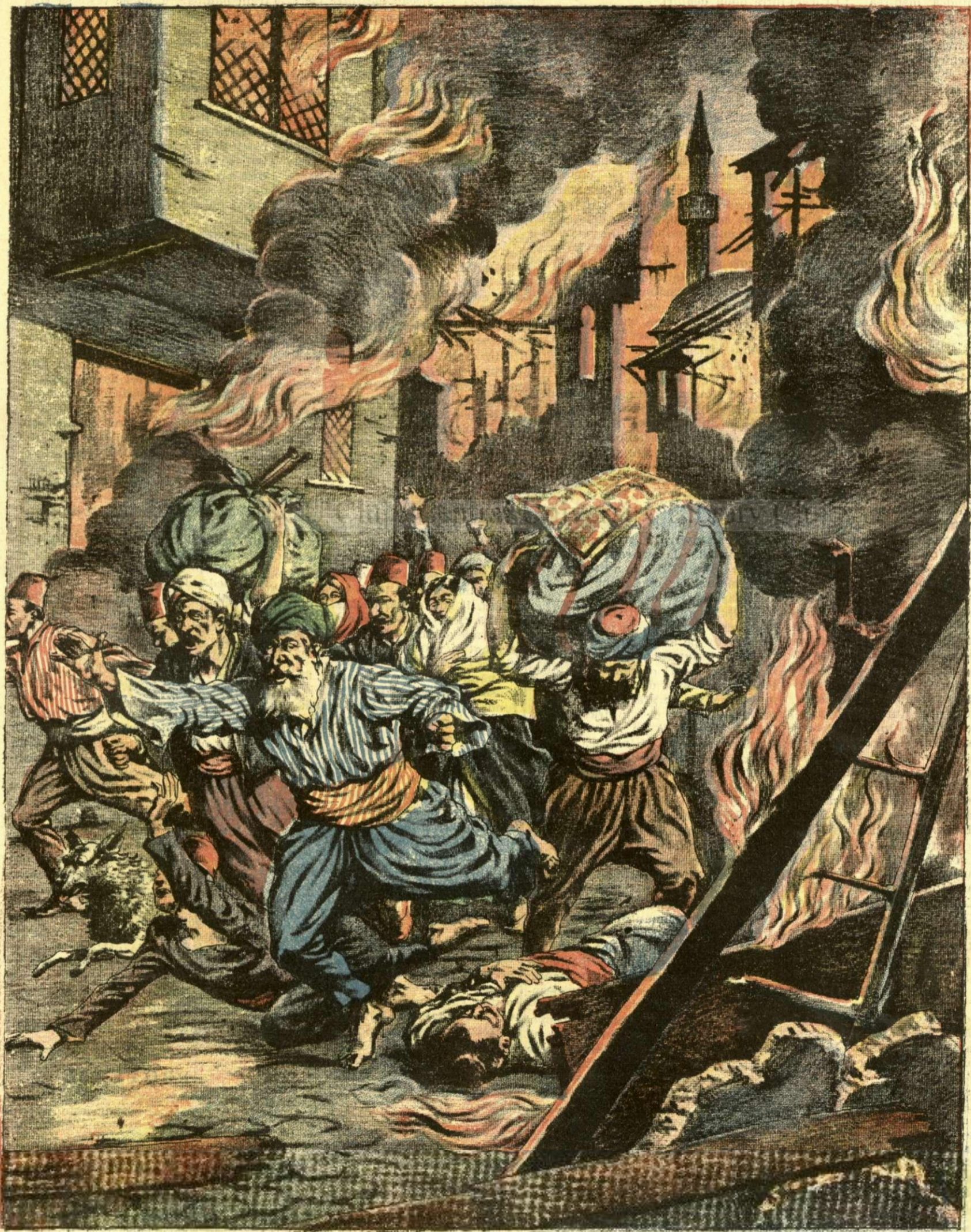
MARELE FOC DIN CONSTANTINOPOL. — (Vezi explicația).