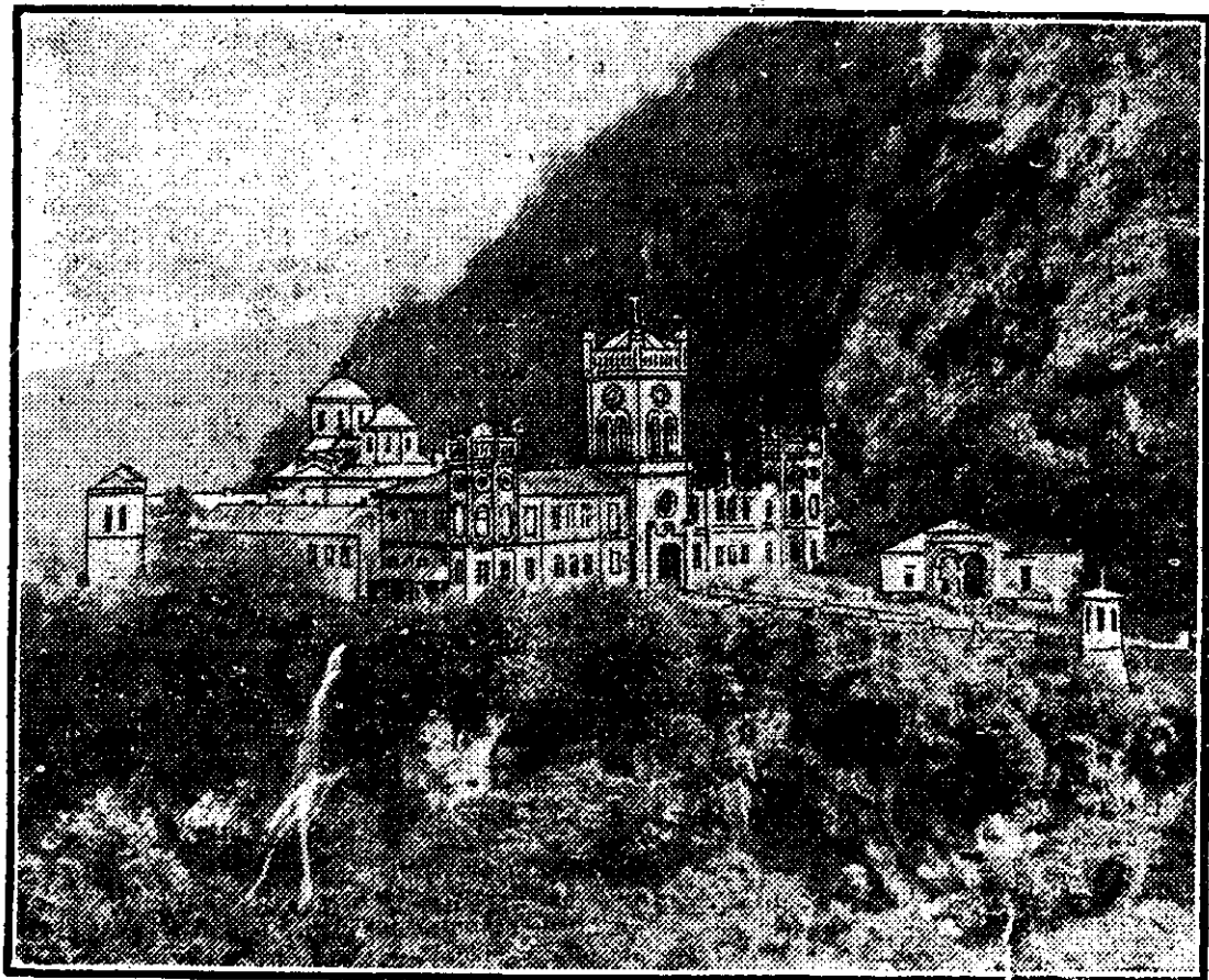
MANASTIREA TISMANA (Jud. Gorj)