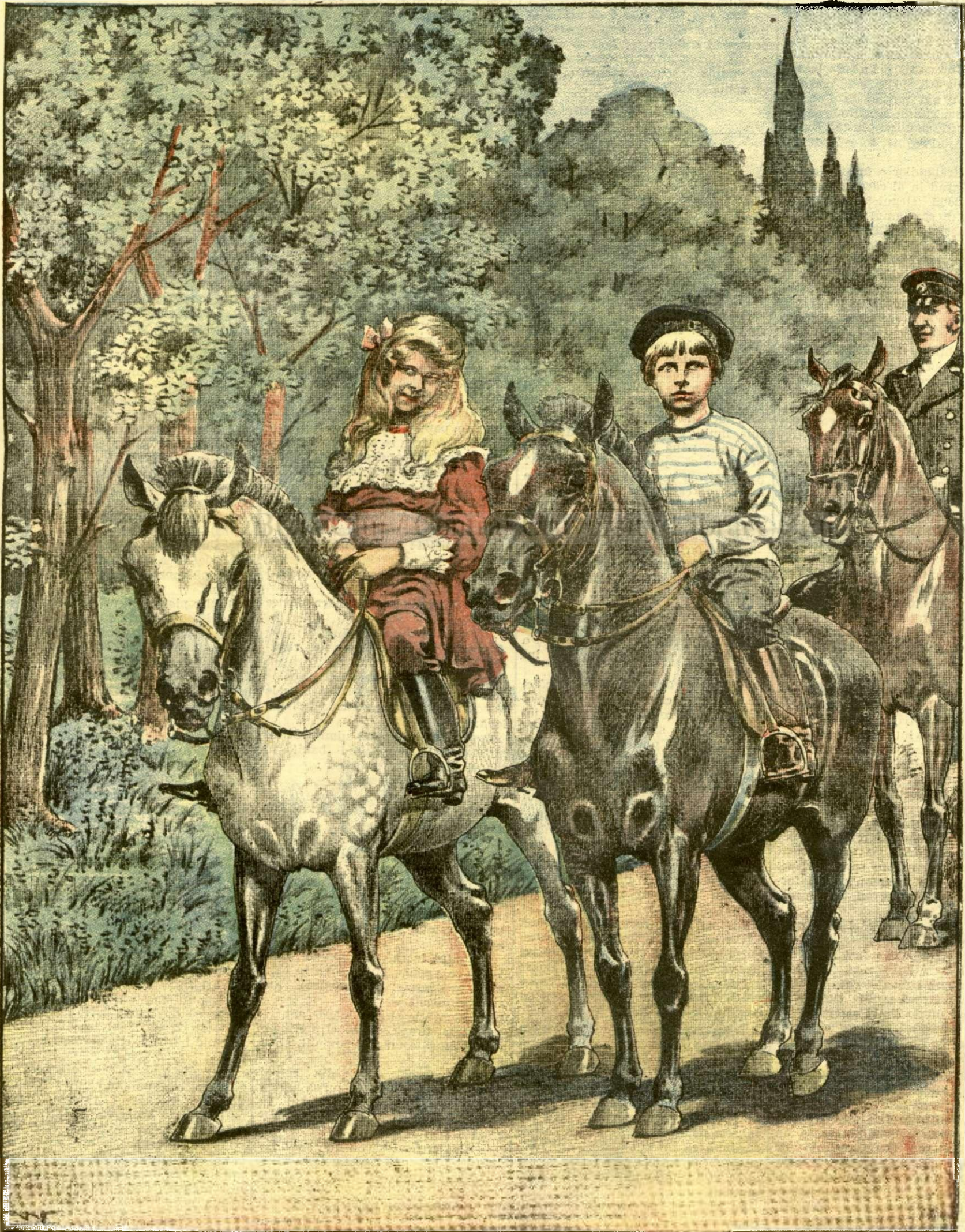
MICHII COPII PRINCIARI IN PARCUL COTROCENI