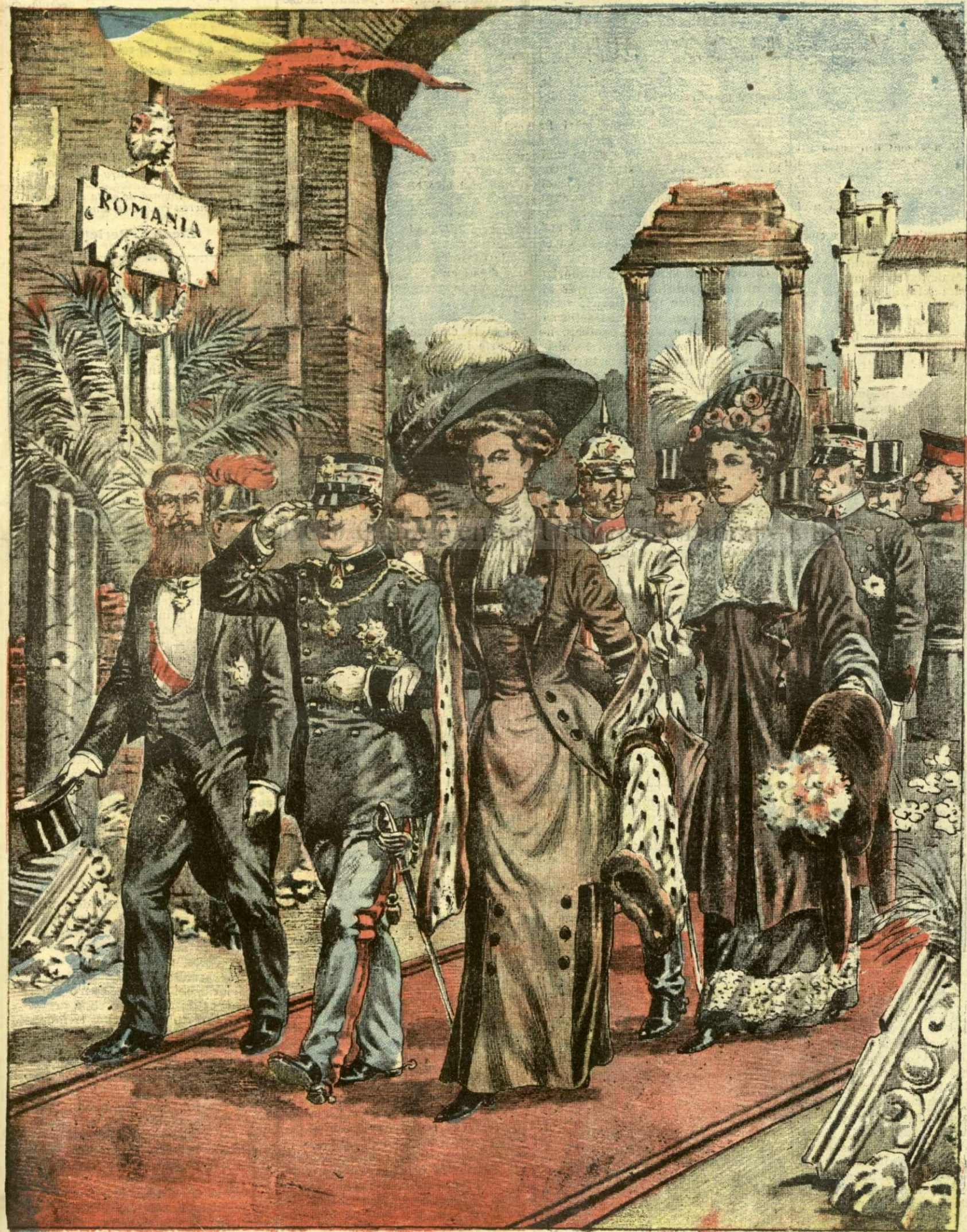
Inaugurarea secțiunii române la Expoziția arheologică din Roma. — (Vezi explicația).