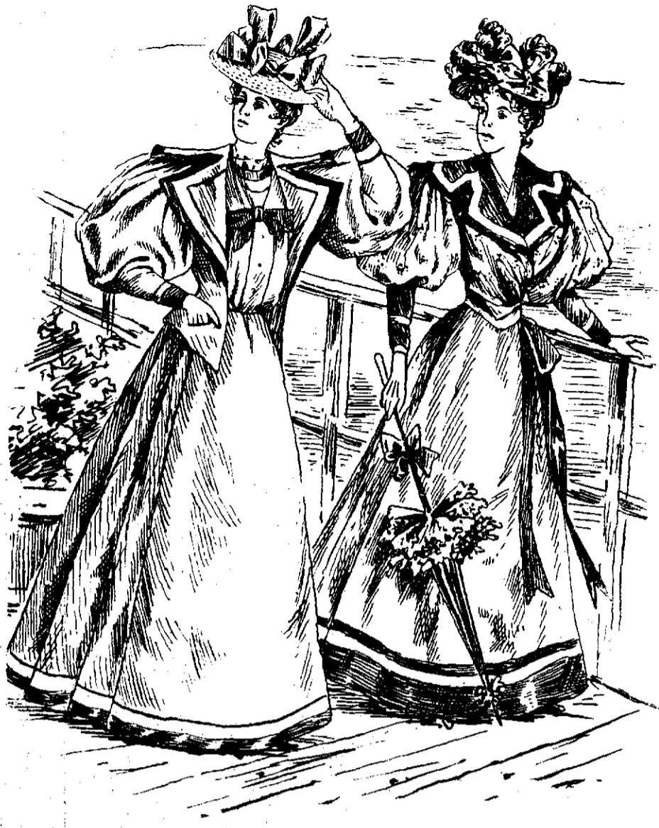
MODA (Vezi explicația)

Românii, la aceste minuni de vitejie ale Domnului lor, se însufieșesc și încep lupta cu mai mare tărie și îndrăzneală. Dar Sinan a ajuns deja și a trecut podul; de o dată însă Mihai îl oprește în față; Cocea îl izbește în spate, Kiraly cu tunurile îl fulgeră în coastă și îl rărește rindurile înfricoșat. Încearcă bătrânul vizir să și pună din nou oștile în rînduială, dar în deșert; izbândă de acum înainte este a românilor. Eroul Mihai făcând o nouă izbire, cetele turcești încep să fugă către baltă, prăvălindu-se unii peste alții: artilerie, cavalerie, pedestrimă, ca să treacă mai iute podul; trei pași, un vizir, un beș, 20 sangiaci cu turci mulțime, se nomolesc în mocirlă și sunt uciași până la unul. Sinan chiar, în ameteala fugii tîrît de ai săi, e călcat în picioarele cailor; se ridică, dar ajungînd pe pod e lovit în frunte de o suliță și cade cu cal cu tot în baltă, perzîndu-și chiulaful și feregeaua; calul moare sub dînsul; el însuși ar fi perit d'o moarte sigură, pe când înota în noroiu, dacă