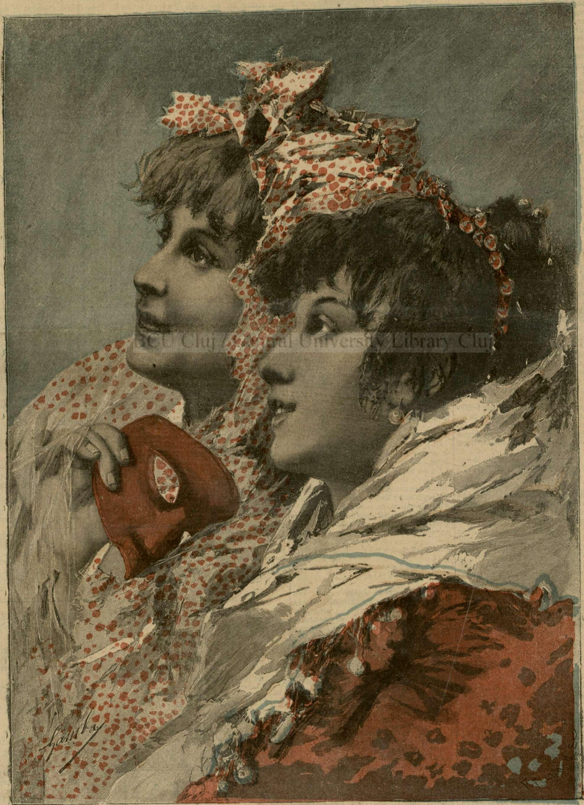
Două tipuri de framușețe. - (Vezi explicația).