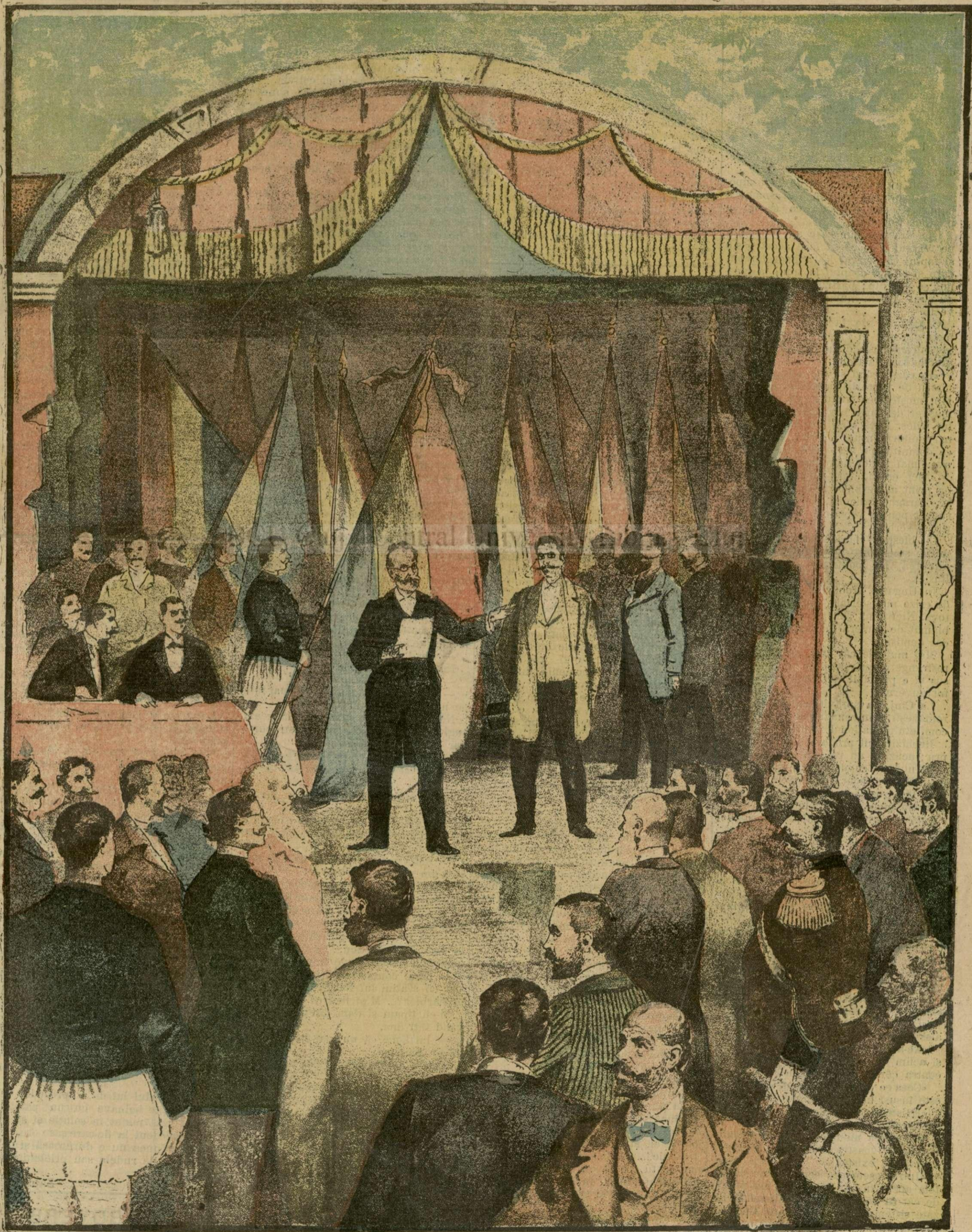
Marele meeting al Ligei culturale.—(Vezi explicația)