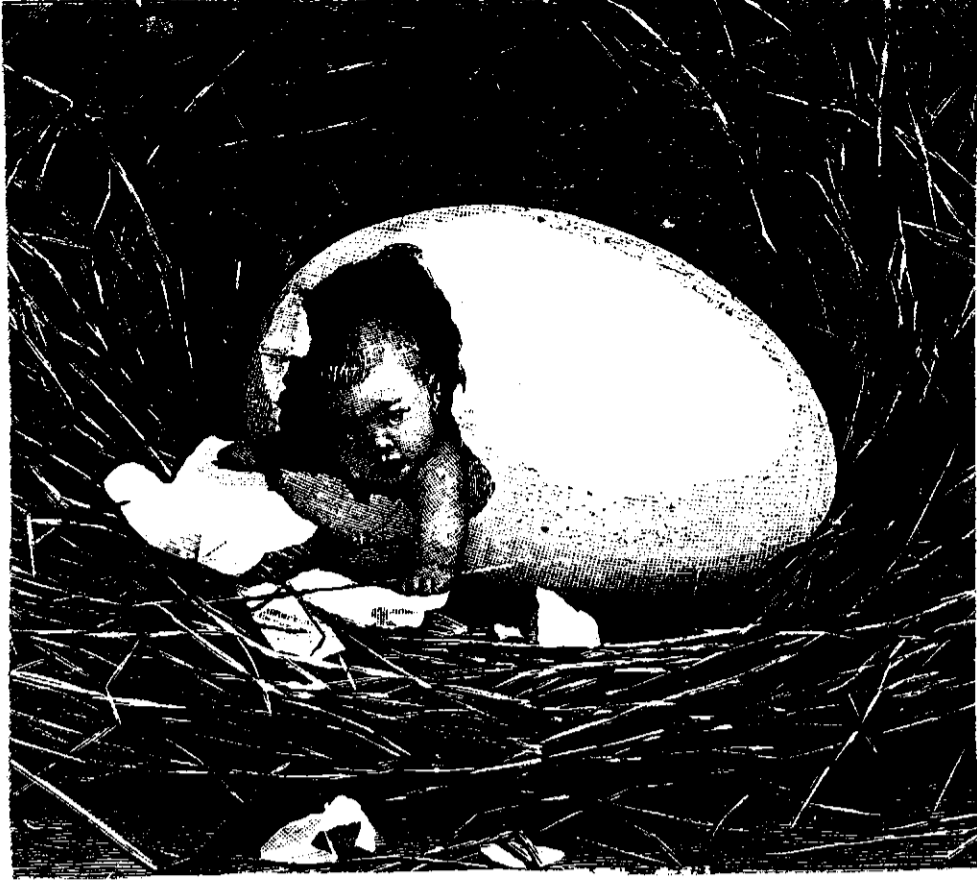
Prințul Carol de România.—(Vezi explicația).

Cei doi uriași, auzind cele spuse de vânturile lor, plecară să vadă cine sunt cei trei cari cutează să le înfrunte puterea. Tocmai atunci Seamăn, Mugur și Frunziș, se apropiară de peșteră, ac-