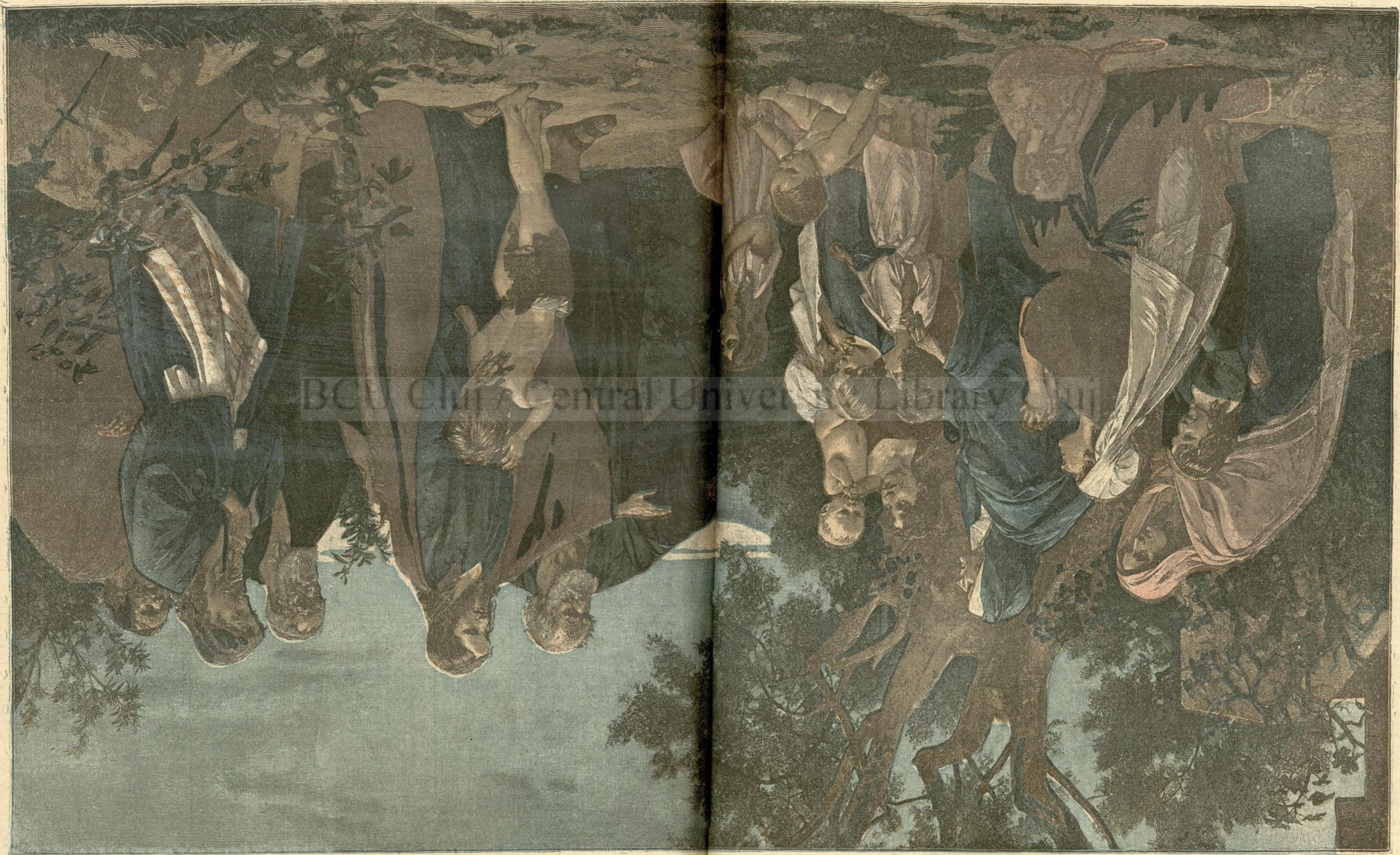
LASATI COPPI SA E LA MINE. - (Vizi xphrafi)