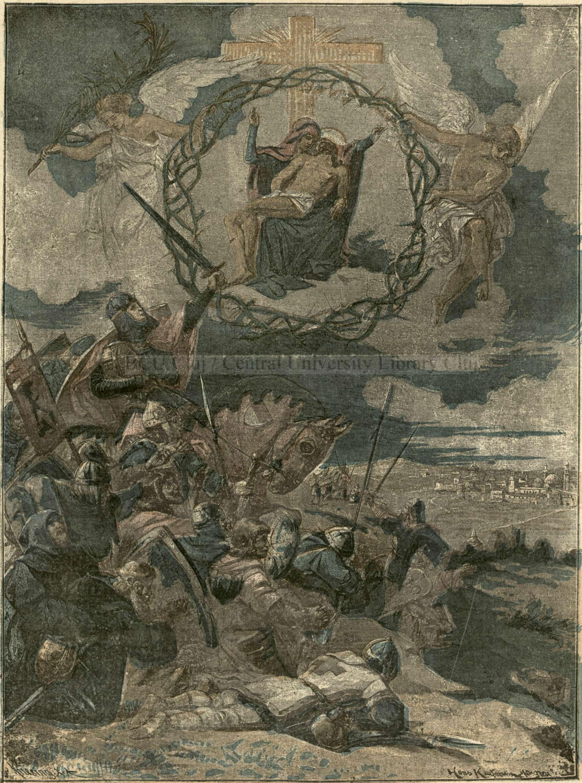
Gottfried de Bouillon înaintea Ierusalimului. — (Vezi explicația)