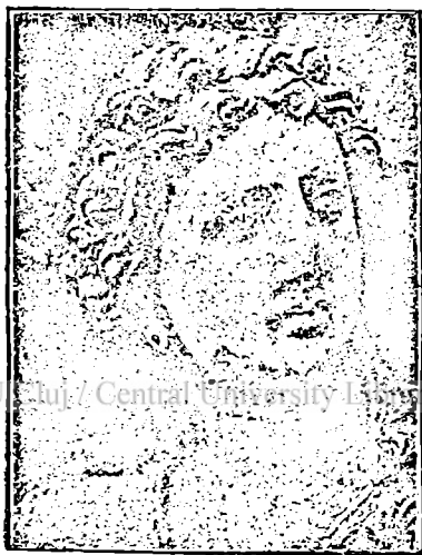
Cap de statue aducând aminte arta lui G. Mazzoni (d. Bartoux).

S'a dat peste o întreagă colonie de clădiri budiste de o frumusețe rară. Ele erau încă în picioare