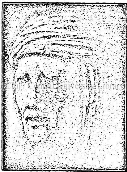
Tip de scit din veacul al III-lea (d. Barthoux)

„Un stupas este un edificiu de zid, cu mai multe rânduri, peste 20 de metri înălțime și destinat în principiu să păstreze relicvele lui Budha puse în centru“.