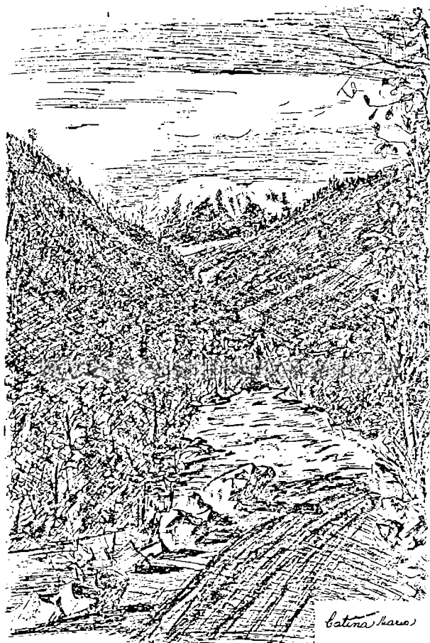
Din Carpații bănățeni

vaste probleme alături cu cea a transportului. In