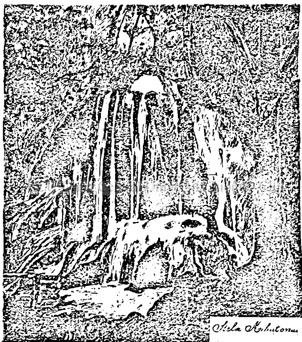
Din Munții Banatului.

prin organizarea și amenajarea turistică, prin publicațiuni, excursii ajutoare, care de foarte multe ori vin din străinătate și dela stat și dela particulari. O deosebită atenție pentru apărarea națională dau a-