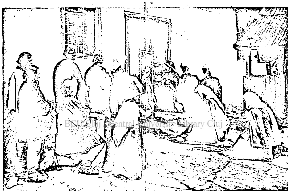
Botez in comuna Şugag jud. Siiu fotografiat în anul 1905.