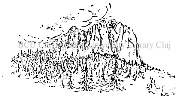
Fig. 1. Din munții Hășmașului-Mare (Transilvania).

Carpații moldovenesti , împăduriți mai peste tot, alcătuiesc rama răsăriteană a Ardealului. Granița politică veche, a bunului plac și a samavolniciei celui puternic, trece în lungul lor. Granița naturală însă nu există în această parte. Trecătorile lesnicioase ușurau pribeșilor din Ardeal să se așeze în Moldova, ori cărdurilor de oi ale Brețeanilor să scobească prin Vrancea, spre câmpiile depărtate. Toate râurile care curg în Moldova, au afluenți care taie poteci în curmezis, ca și când ar fi anume, ca să săvârșească porți