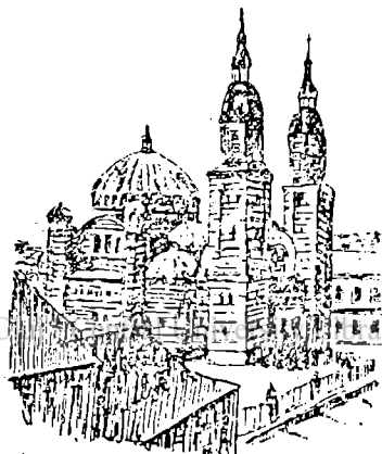
Fig. 3. Catedrala ortodoxă din Sibiu.

trecutului nu sunt dărâmate ci din potrivă păstrate cu sfințenie pretutindeni. Alături de turnuri de fortificații se înalță clopotnițele bisericilor; împrejurul lor sunt rădicate clădiri moderne ori vile cochete. Peste tot se vede cultul arborilor și al florilor. Soselele sunt împrejmuite cu arbori fructiferi de regulă sau duzi rămuroși. În fața caselor se pun arbori umbroși. Chiar pe ogoarele cu cereale se văd presărați