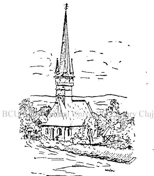
Fig. 5. O biserică greco-catolică.

Sunt sate, ca Rășinari ori Selistoa, care bat orașele. Nu sunt socotite drept sate, de cât ad-