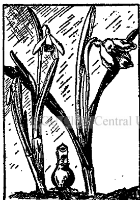
Fig. 1. — Clopoței obișnuiți în stânga și Clopoței bogăți în dreapta.

Planta nu se poate bizui pe seminți. Ca să se formeze seminți sănătoase de obicei vin într'ajutor insectele. Ele poartă polenul de pe o floare pe alta. În graba de a vesti lumii primăvara, amăgită de câte-va zile de căldură, floarea de