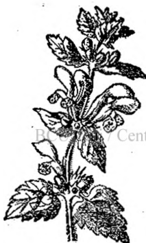
Fig. 13. — Urzică-moartă.

Păpădia ne apare ca o ființă ce simte, care-și mișcă părți din corp dacă nu se poate mișca din loc în loc. Nu trebuie deci să socotim numai animalele în stare să simtă, să se miște, să se apere. Deosebire între plantă și animal nu e