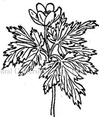
Fig. 3 — Floarea Paştelui.

Alături de ei, printre ei, e Floarea-paştelui ( Anemone nemorosa ). Şi ea iese de vreme. Nu are însă bulb, ci trunchiul subpământean este gros, plin de rezerve hrănitoare. Cum vine primăvara dă din vârf o rămurică, ce se înalţă, poartă frunze adânc crestate, din mijlocul cărora răsare florica altfel alcătuită de cât a celorlalte pomenite până aici. Are cinci petale răsfrânte, la unele galbene, la altele albe, aburite cu trandafiriu pe dedesupt. Frumuseţea acestei plante stă tocmai în îmbinarea frunzelor palide, verzui, întinse orizontal ca să prindă cât mai multă lumină, cu floarea din mijloc albă, cu un bumb galbăn în mijloc, al staminelor numeroase.