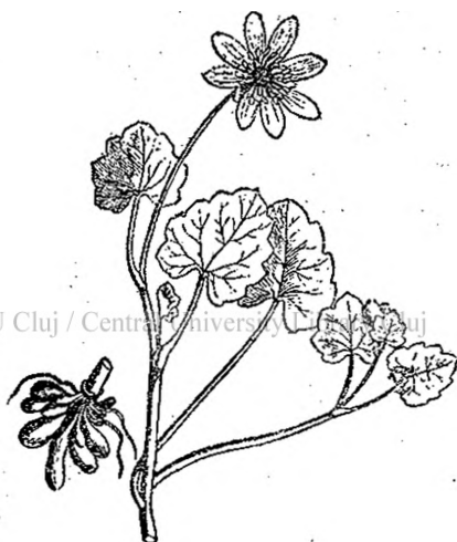
Fig. 4. — Grăușor.

În tovărășia lor, dintre frunzele uscate strălucește a o steluță boghioasă floarea galbenă aurie de Grăușor ( Ficaria ranunculoides ), a cărei frunze verzi, strălucitoare sunt căutate ca salată