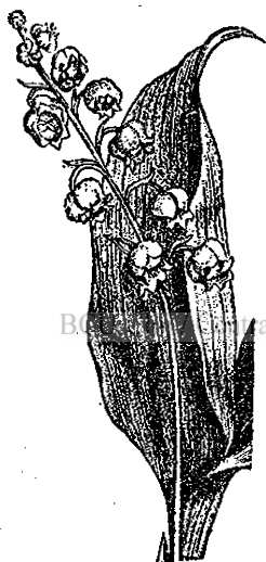
Fig. 6. — Lăcrămioare. *

Prin păduri nu se prea abat căci nu prea dau de flori. De aceia gingașele lăcrămioare , numite și mărgăritarele , se silesc să cheme din depărtare insectele prin puterea aromei lor și apoi prin strălucirea gingașelor floricele, înșirate de-