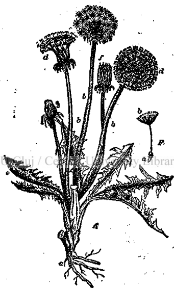
Fig. 11. - Păpădia . a = trunchiul; b = lujerele goale ce poartă florile; c = frunzele; d = florile deschise; e = balonul de puf; f = învălișul florilor; g = frunzele verzi apărând florile. F = fructul (a) purtat de puf (b).

Una din cele mai răspândite burueni ce dă drumul florilor aproape o dată cu celelalte pomenite, este păpădia ( Taraxacum officinale ).