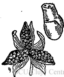
Fig. 8. — Fructul de toporaș, deschis ca să se imprășteie semințele. A-lătura o sămânță cu bucățica moale pe ea.

Dintre ele mai harnic este toporașul , zis și violeta ( Viola odorata ) cu parfum adormitor și culoare sinilie, ce atrage. I se mai zice prin unele locuri din România și Tămăioară. In adevăr aduce cea dintâi tămâiere în altarul sfânt al naturii de primăvară. Parfumul pentru toporași este tele-