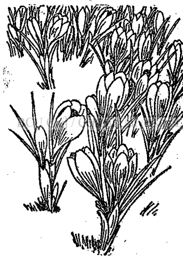
Fig. 2. — Brândușe.

alte plante cu colori mai oacheșe, steaguri mai ademenitoare pentru insectele desmorte, care încep, prin zumzetul sborului lor, să cânte imnul primăverii.