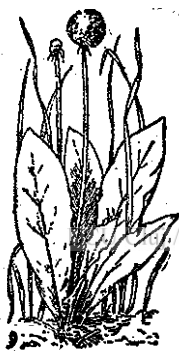
Fig. 12. — Păpădia crescută în iarbă, cu frunzele ridicate spre soare!

Mai simțitoare ca păpădia rar plantă se întâlnește la noi. Când crește printre alte buruieni care o înăbușă are frunzele lungi, ridicate 'n sus,