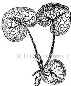
Fig. 5. — Popivnic.

Frunzele ei bat la ochi, căci sunt de un verde închis pe fața de sus, argintii pe cea de jos și rotunde pare că ar fi tăiate cu foarfeca. Intre două frunze se vede o floare puțin băgată 'n samă. E vineție și cărnoasă. Spre deosebire de celelalte flori ea nu se aburcă spre soare, ci pare că fuge de lumină, se îndeasă printre frunzele moarte rămânând aproape de căldura pământului.