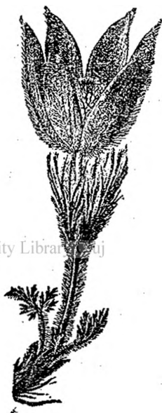
Fig. 9. — Floare de deditei.

mântean mai gros, cu rezerve de hrană, e lung, adâncit în pământ. Rădăcinele sug repede apa din topirea zăpezii. Tot repede prind să deie frunzele ca niște fire rupte, adunate grămadă, buchet, din mijlocul cărora tot repede se arată bobocul liliachiu învălit într'o haină de lână, de un puf moale și argintat ce-i ține cald. Tot iute, căci vreme nu e de perdut, din boboc se desfășoară frumoase petale liliachii, cu felurite ape, când mai roșcate, când mai deschise. Cât ține numai bobocul, e bucuria copiilor, care îl poartă pe la ochi, îl desmeardă, cum fac și cu mâțișorii mătăsoși de salcie. Când floarea se desfășoară e bucuria albinelor, căci marile număr de stamine galbene cuprind mult polen, hrana trebuitoare în stup. De aceia în jurul florilor de deditei e un zumzet continuu, mulțumirea albinelor care dau busna spre ele sau bâzâitul vre-un bărzăun cu glas mai gros.