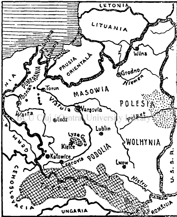
Fig. 1. Harta Poloniei (d. Ahlers)

diș și mâl lăsat de pe urma topirii ghetarilor din vremea Cvaternară. Spre granița de răsărit, se găsesc mlăștinele dela Pinsk din regiu-