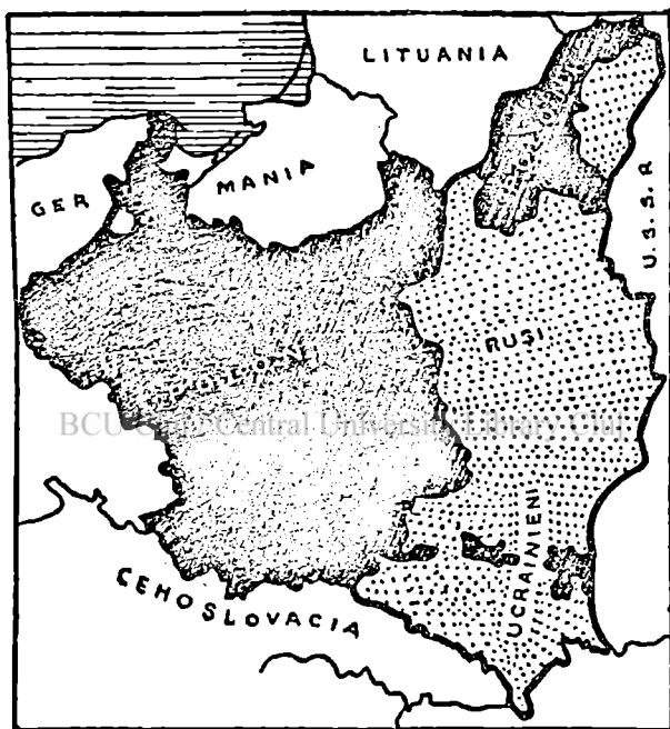
Fig. 4. Populația în Polonia.

Ucrainenii (Ruteni) (peste 7 mil.) locuiesc