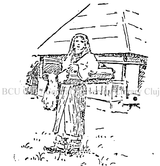
Fig. 2. Portul româncei din Maramurăș.

Rangul de națiune politică, cu toate drepturile legate de el — pământ și egalitate în funcțiuni, beneficii etc., 'sau menținut vremuri și se menine — deși numai nominal, și azi 1) .