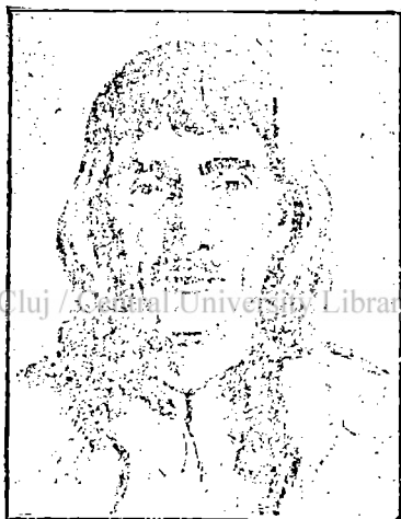
Fig. 1. Tip de român din Maramureș.

De altfel ținutul așa de bine ferit din toate părțile de munți înalți, a atras dela început pe om. Stațiunile preistorice ca cele dela Apșa, Sieu, Sarasău, Rozavlea și Rogna cu sutele de obiecte de piatră și bronz ce s'au găsit în ele, sunt mărturii sigure. Mai târziu în epoca dacică, Maramurășul era limita extremă a lumii trace către