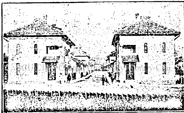
Fig. 1. Colonia Teodorescu din Petroșani.

de oameni beți. În această privință duc recordul Săcuii. E regretabil că consumă cu deosebire rom, spirt, sau coniac, deci băuturile cele mai tari și mai primejdioase. Multe nenorociri de mine provin în urma neglijenței muncitorilor amețiți de băuturi. Lunar se vând băuturi în Valea Jiului în valoare de aprox. 30 milioane lei. Cârциumele sunt în mâinele Ovreilor, numai puține sunt românești. În urma patimei beției, muncitorii și țărani trăsesc în cea mai neagră sărăcie, deși atât muncitorii și țărani au câștiguri frumoase. Azi nu mai