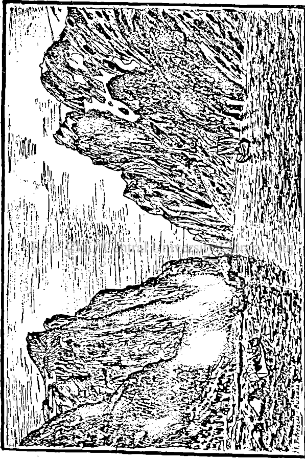
Fig. 2. Fiordul Fjöring.

se lărgeste din nou. Și din nou apare câte o grupă de colibe pescărești, pe dreapta sau pe stânga —