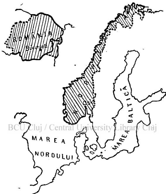
Fig. 1. Intinderea Norvegiei în comparație cu a României.

Așa stând lucrurile, nu știi cu ce să începi mai întâi și nu știi ce să lauzi mai mult, când e vorba