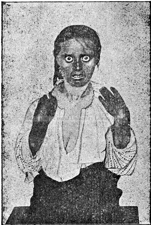
Fig. 3. -- Pelagrosă ajunsă in stadiul de nebunie, cu „masca“ și mănușile pelagroase.