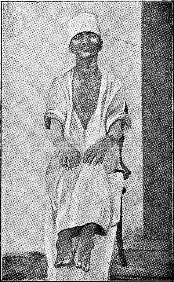
Fig. 1. — Pelagros cu „masca“, „colierul“, „mănușile“ pelagroase.