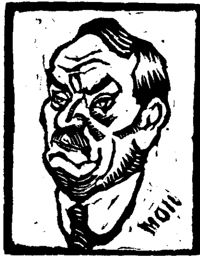
D. Iuliu Maniu

Delegația tinerimii române din Ardeal și Banat s'a prezentat Duminică în 14 Februarie la d. Maniu în Bădăcin și i-a predat în cadrele unei emoționante solemnități